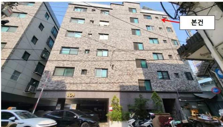
제104동 및 본건 전경