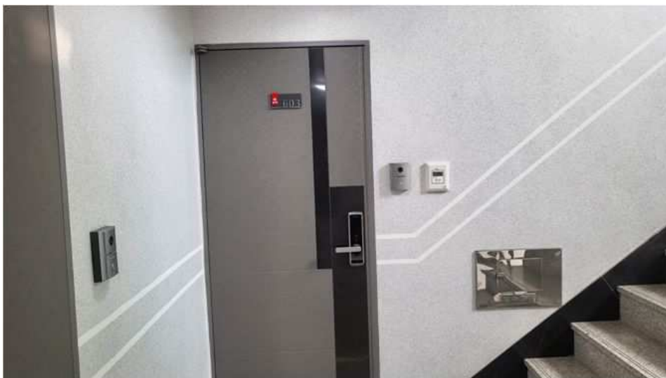
본건 제603호 전경