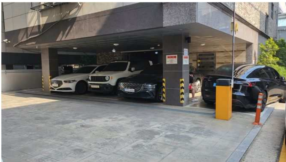
제104동 1층 주차장 전경