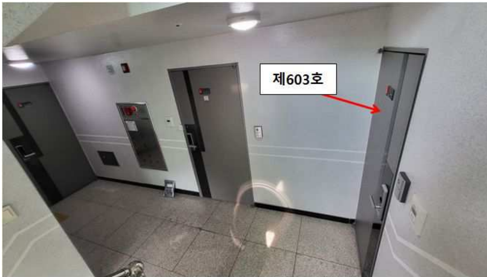
제6층 복도 전경