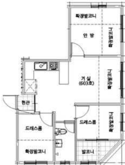
<본건 엠펠리체 제104동 제6층 제603호>

* 본건 현장조사 시 폐문 및 이해관계인의 부재 등으로 상세한 내부 조사는 하지 못하였으며, 이에 내부구조 및 이용상황 등은 건축물현황도, 제한적인 외부관찰, 평가전례 및 인근탐문 등을 기준으로 작성하였는바, 현황과 상이할 수 있으니 경매진행시 유의 및 재확인바람.