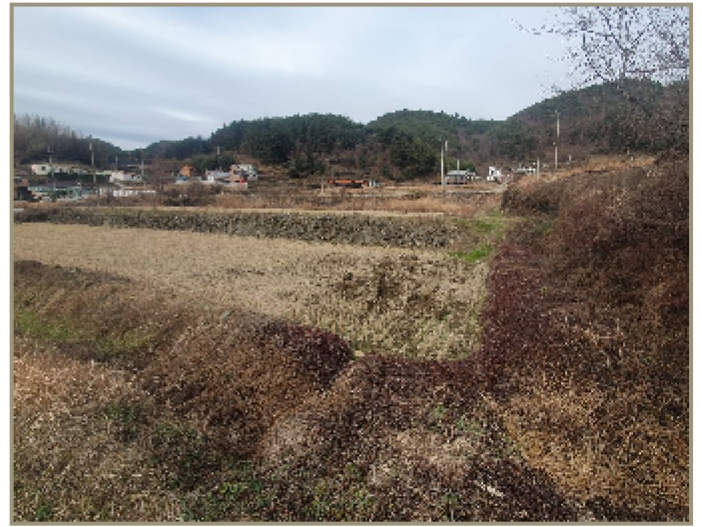
기호(1~6) 및 주위 전경