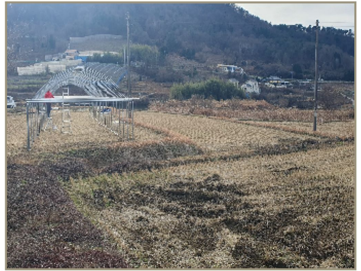
기호(5,6) 일부 전경