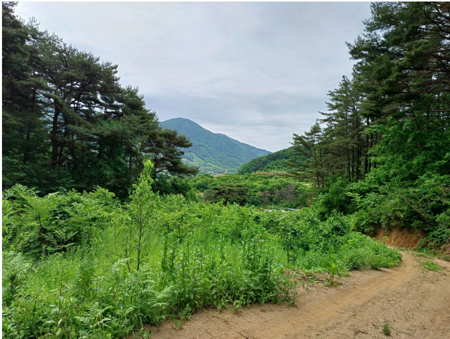
본건 및 주변전경