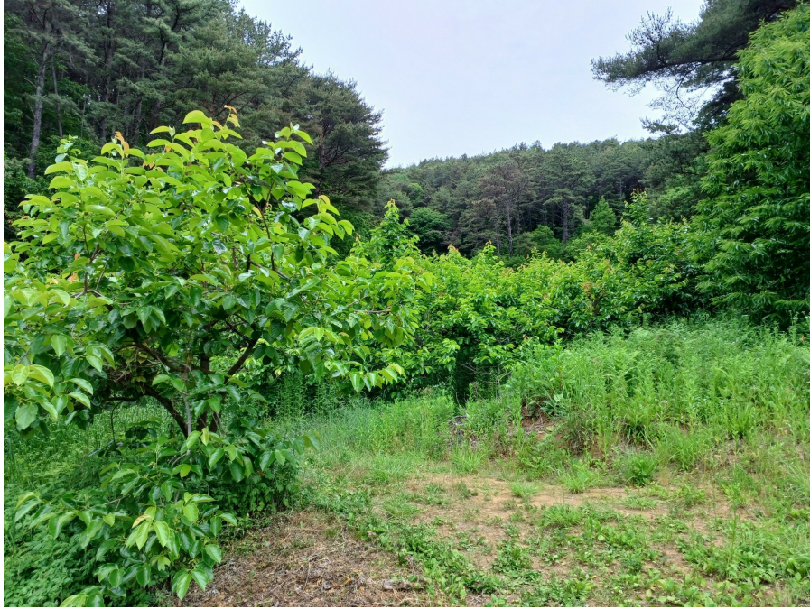
본건 및 주변전경