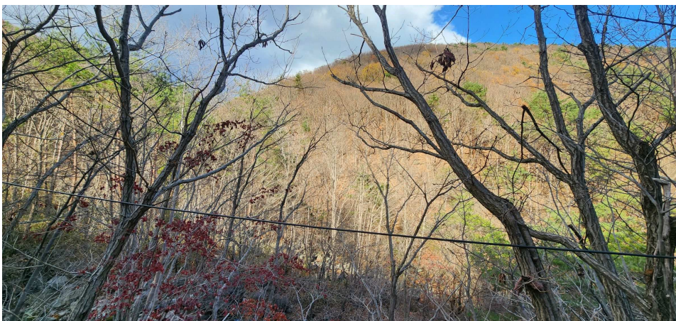
본건 토지 전경