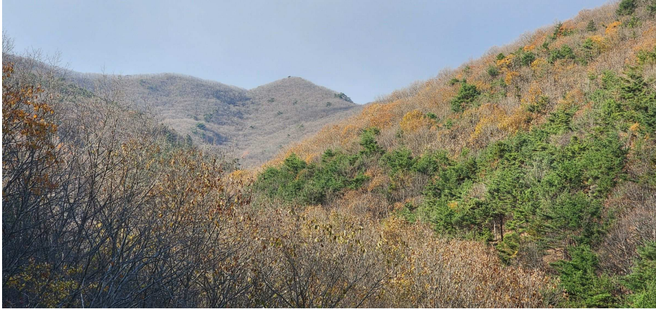
본건 주변 토지 전경