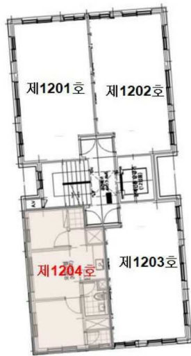
【 호별배치도 】