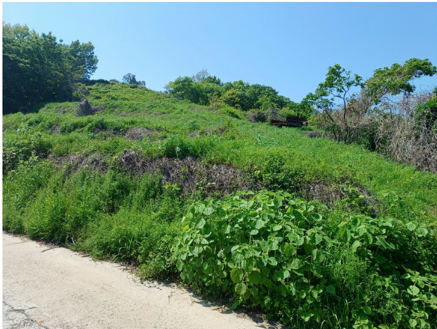
1, 3, 4, 6