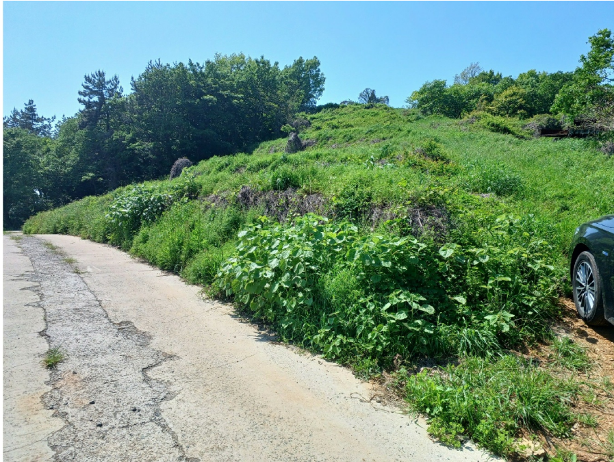
1, 3, 4, 6