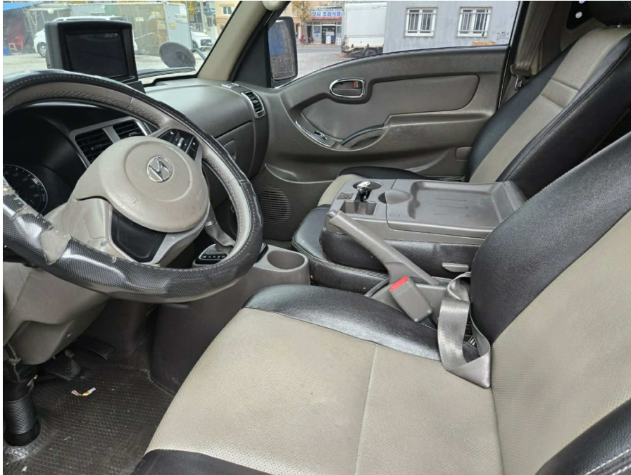
본건 운전석 내부