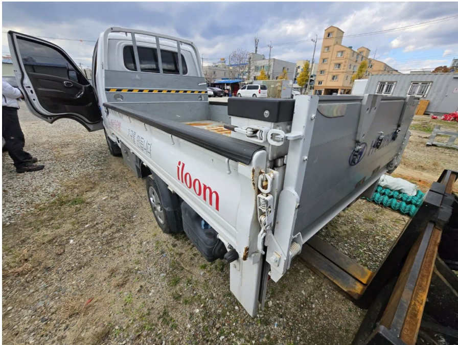
본건 후면 및 측면