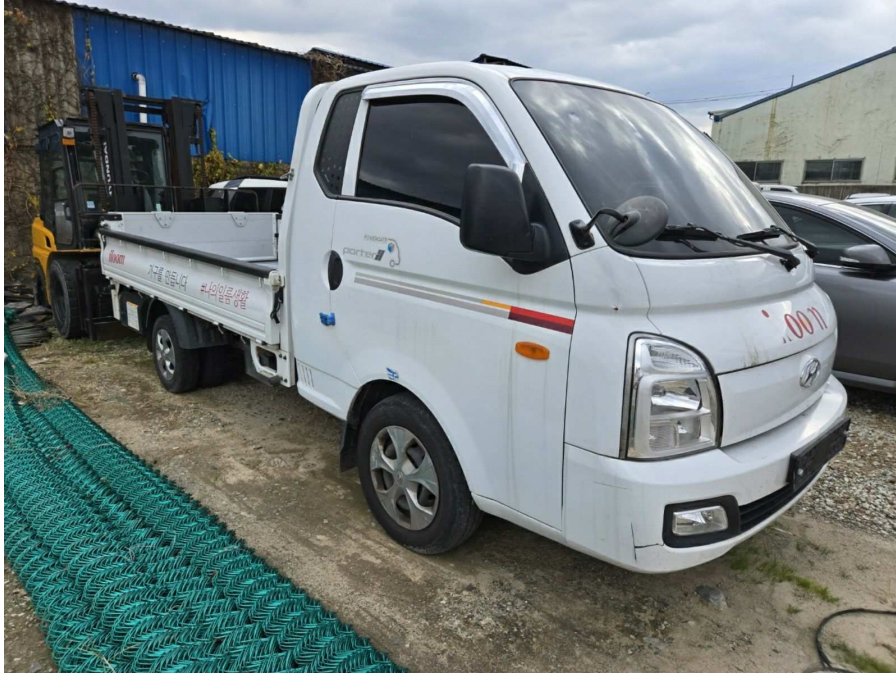
본건 정면 및 측면