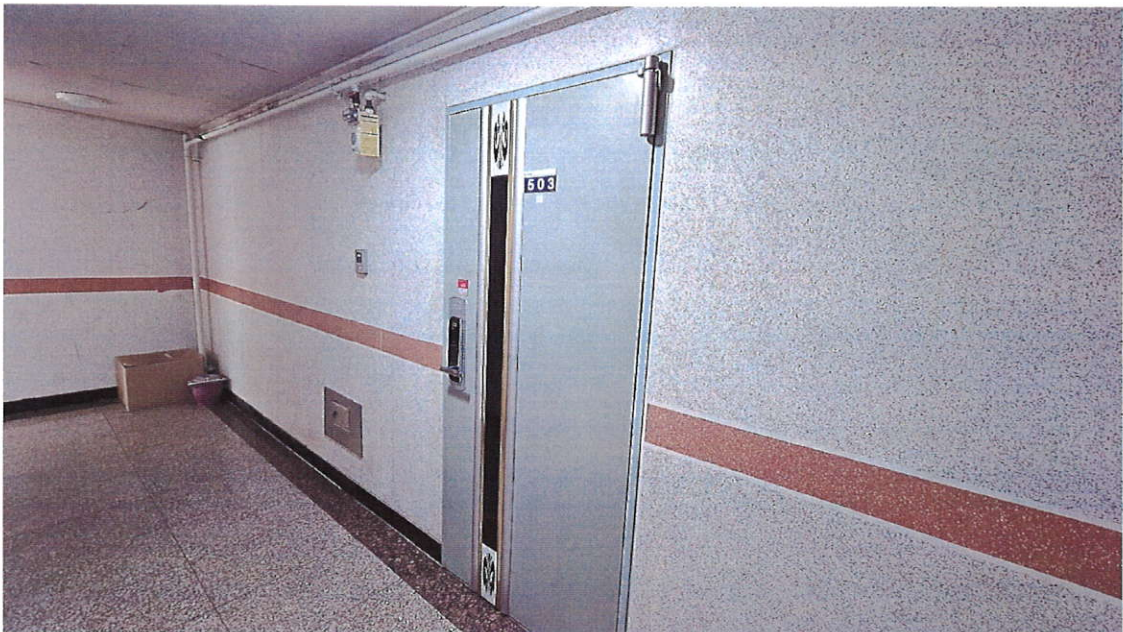
본건 구분건물 사진