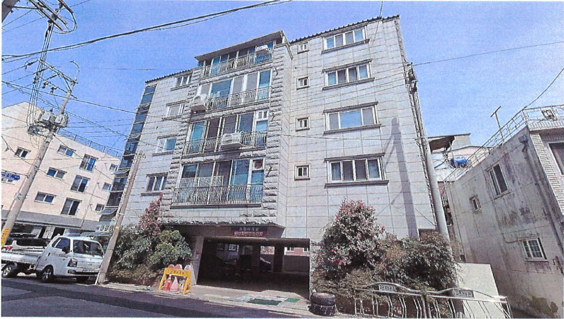
본건 건물 사진