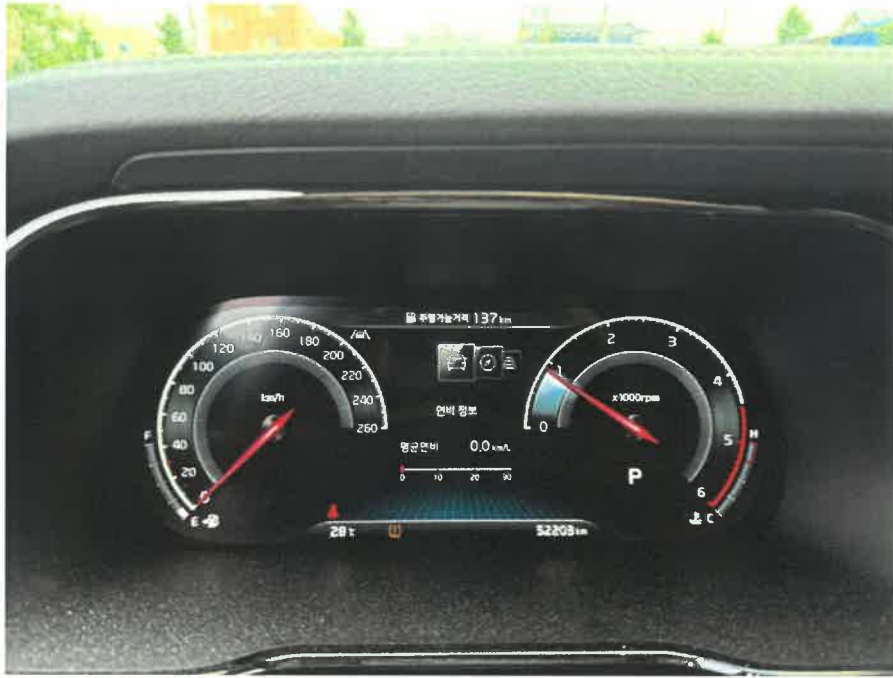
본건 차량 내부 계기판