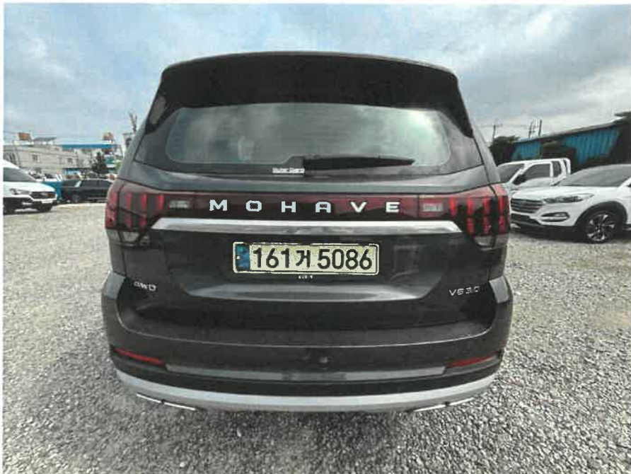
본건 차량 후면