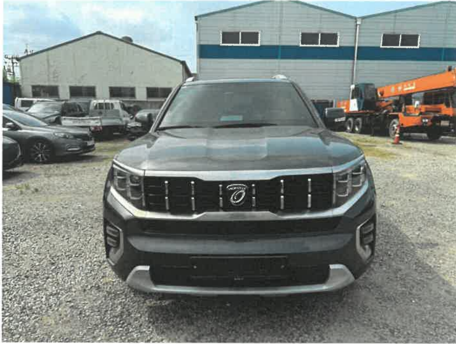
본건 차량 전면