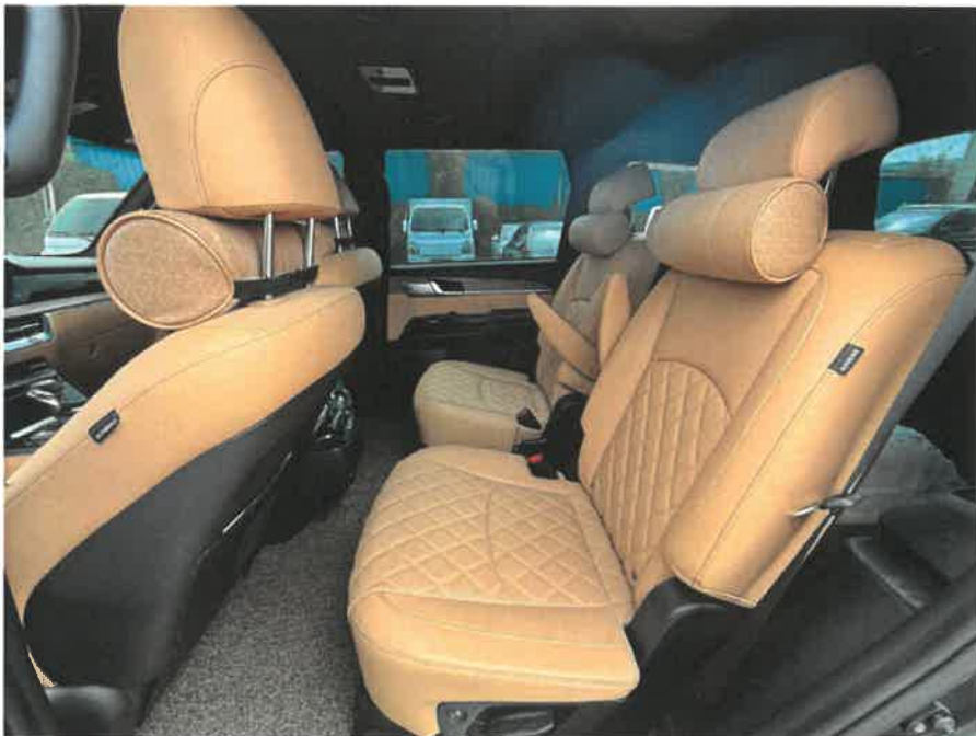
본건 차량 내부