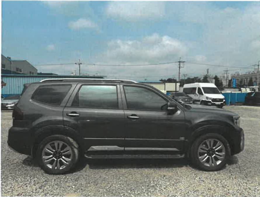
본건 차량 측면