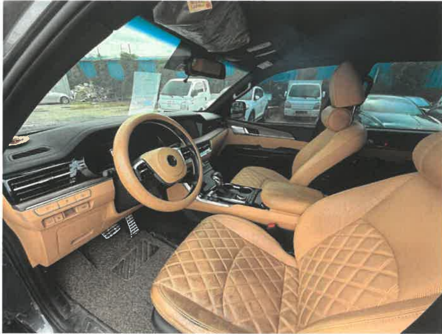
본건 차량 내부