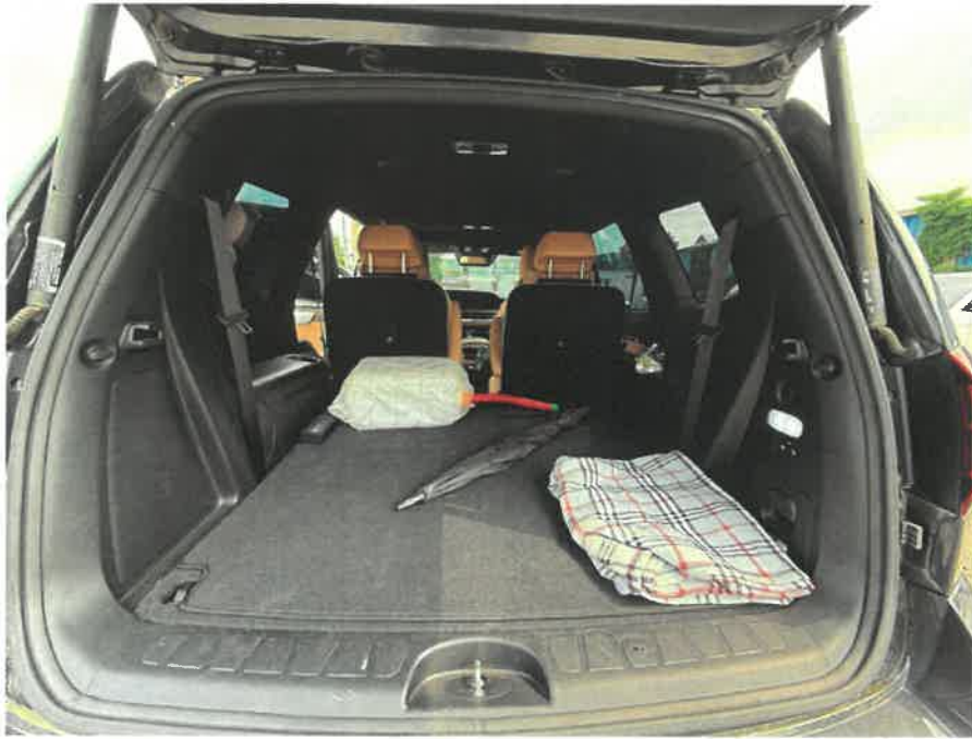
본건 차량 내부