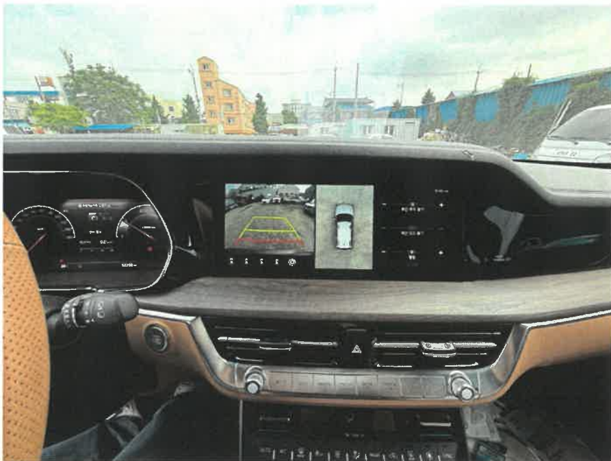
본건 차량 내부