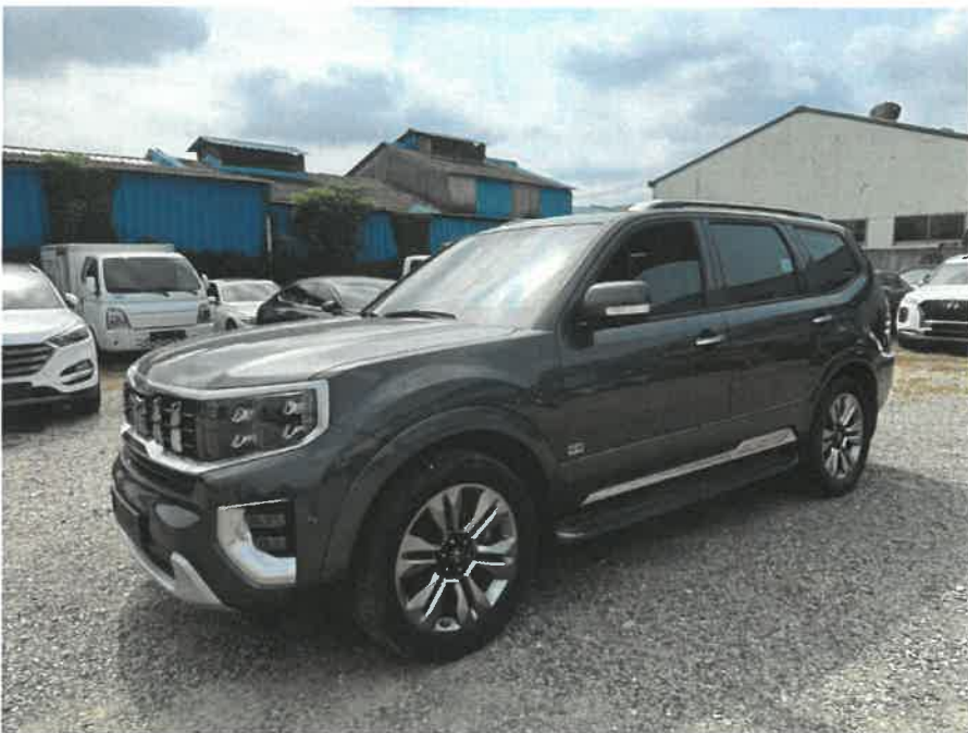
본건 차량 측면