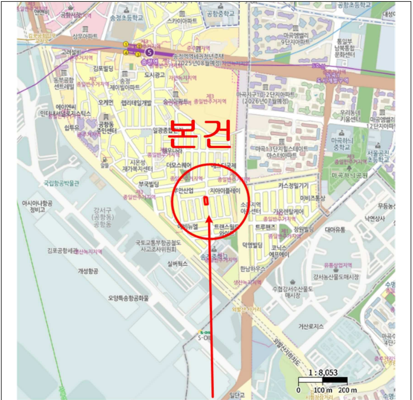
본건(마곡대림밸리 제 5층 제 504호)

소재지 서울특별시 강서구 공항동 678-1 마곡대림밸리 제5층 제504호