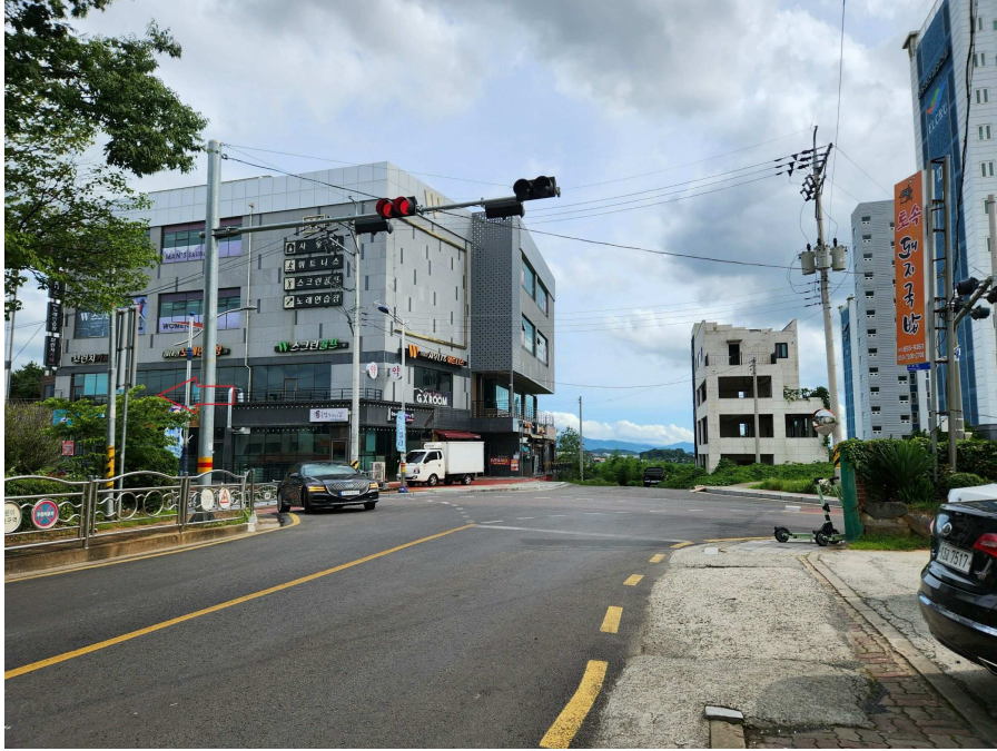
접면도로 및 부근의 상황 등 북측에서 남측을 향하여 촬영