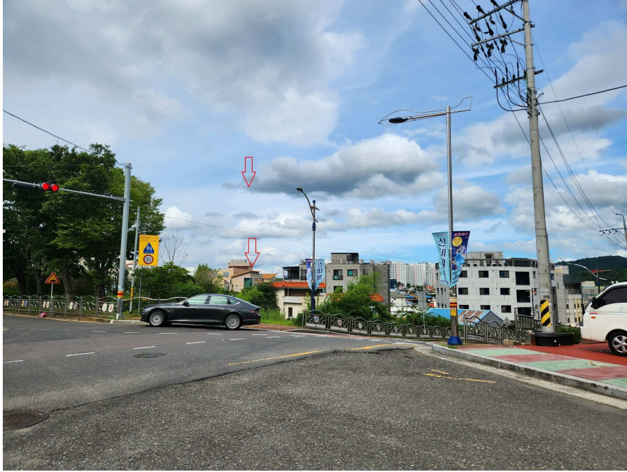
접면도로 및 부근의 상황 등 북동측에서 남서측을 향하여 촬영