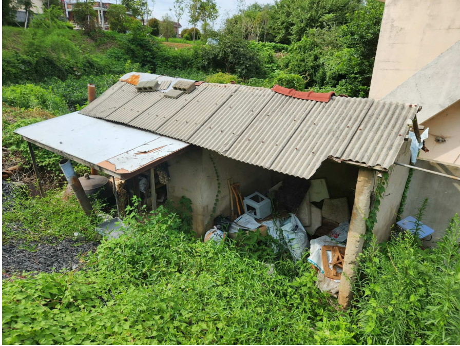
제시외 건물 [기호ㄱ]