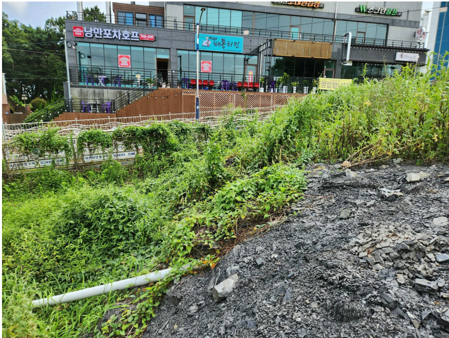
본건의 전경 북측에서 남측을 향하여 촬영 [동측 경계부근을 중심으로 촬영]