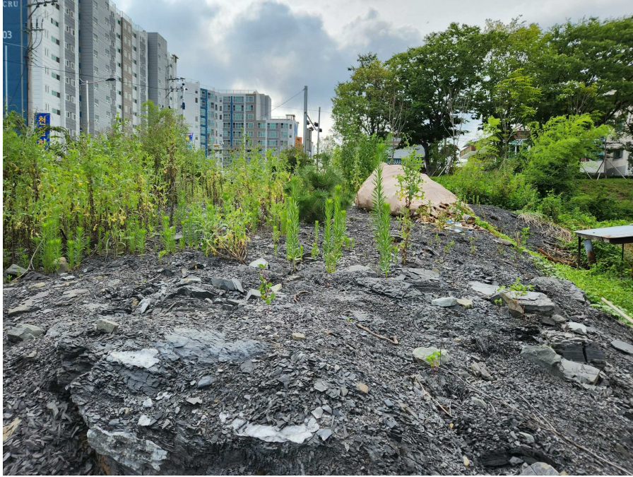
본건의 전경 북동측에서 남서측을 향하여 촬영