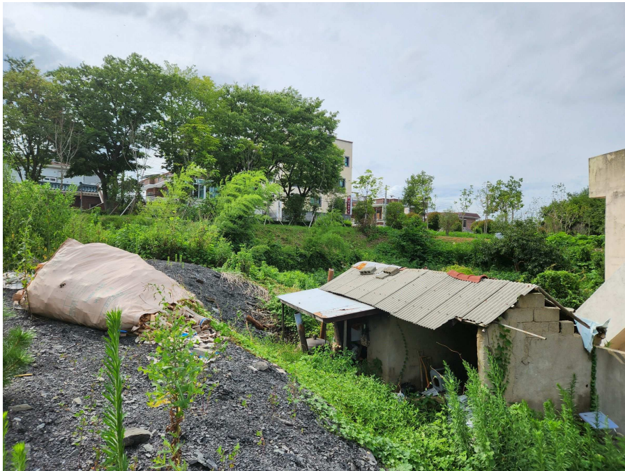
북동측 경계부근을 중심으로 남동측에서 북서측을 향하여 촬영