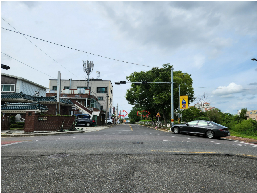
접면도로 및 부근의 상황 등 남서측에서 북동측을 향하여 촬영