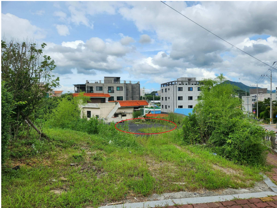
본건의 전경 북측에서 남측을 향하여 촬영