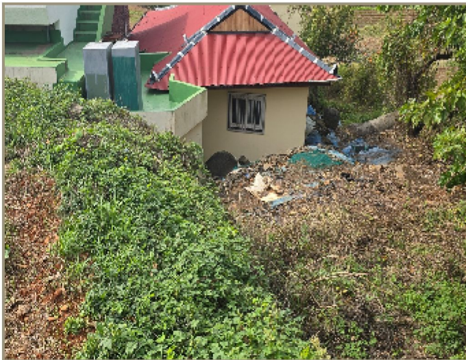
기호(3) 및 타인점유부분 전경