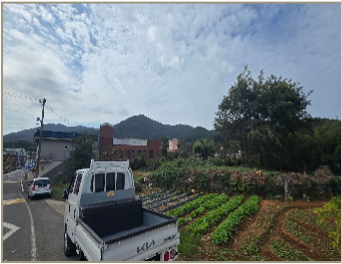
본건(1~3) 및 주위 전경