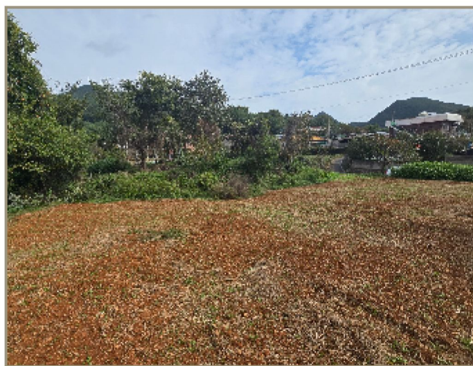
기호(1) 일부 전경