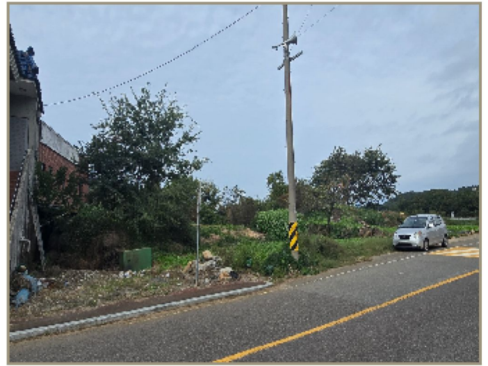
기호(1) 및 주위 전경