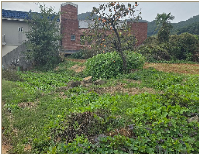
기호(1) 일부 전경