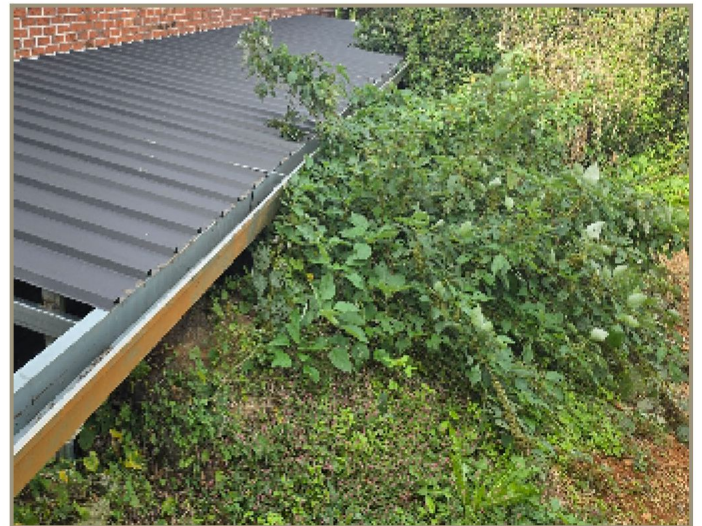
기타[기호(1) 일부 타인점유 추정부분] 전경