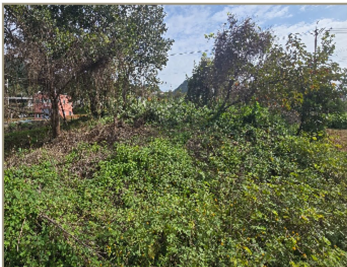
기호(1) 일부 전경