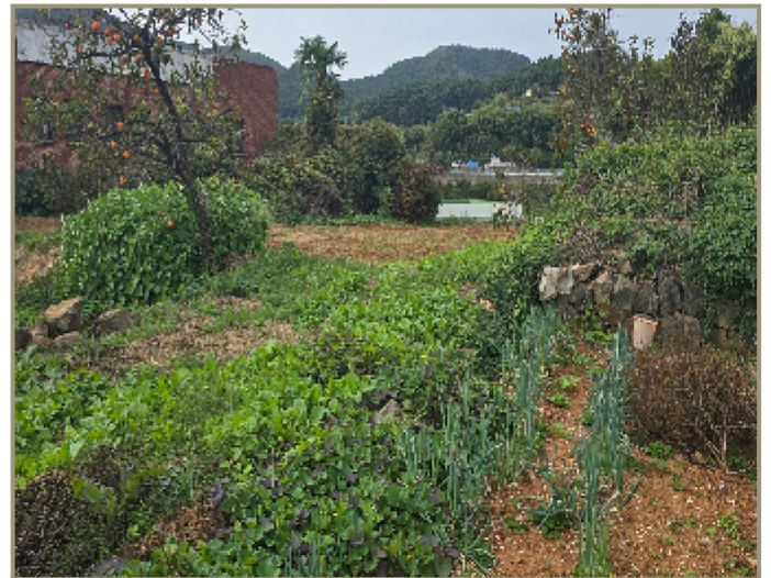
기호(1) 일부 전경