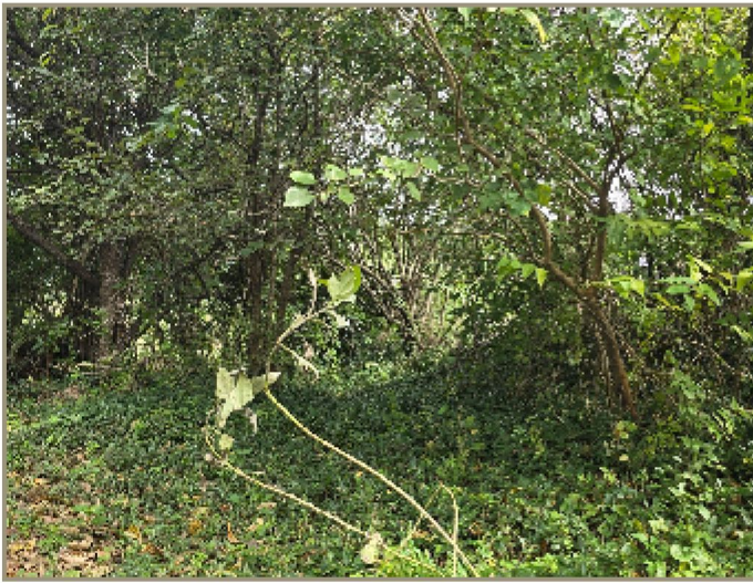
기호(2) 일부 전경