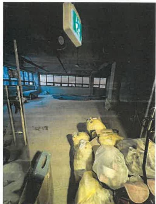
본건 (2) 4층 405호 전경