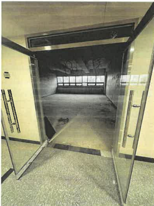
본건 (1) 2층 202호 전경