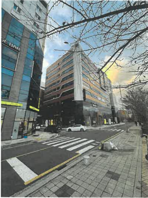
본건 및 주변 전경 - 1