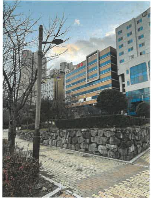
본건 및 주변 전경 - 2