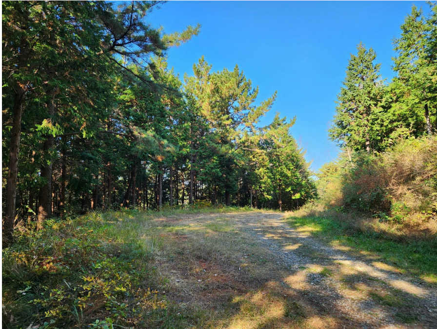
기호5 및 임도의 상태 등