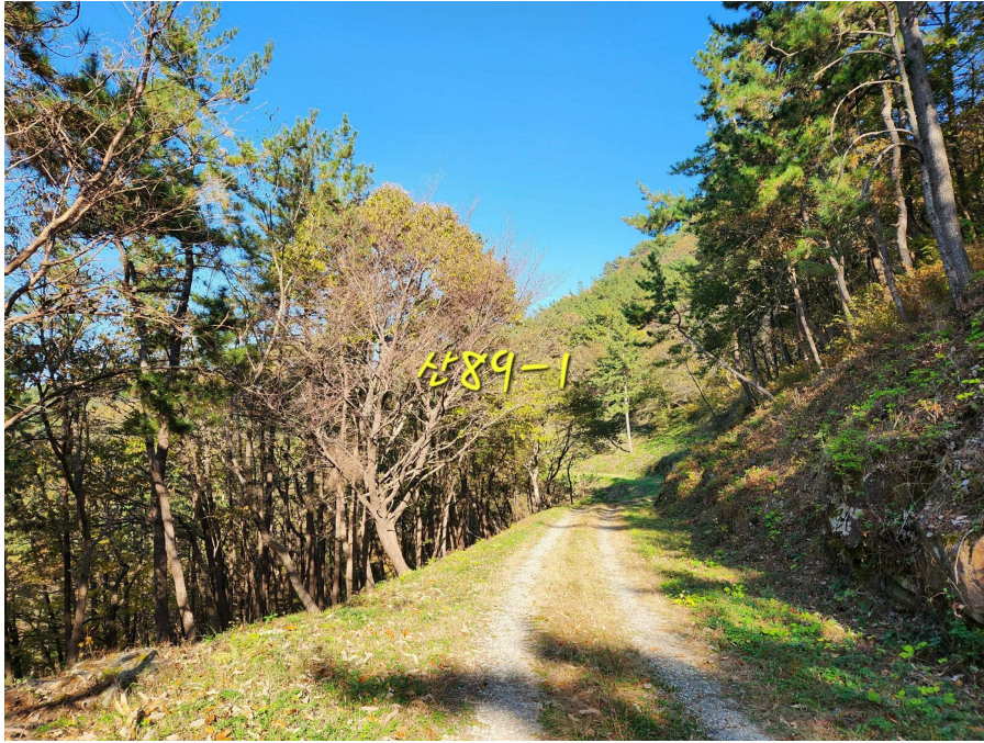
기호4 및 임도 등의 상태