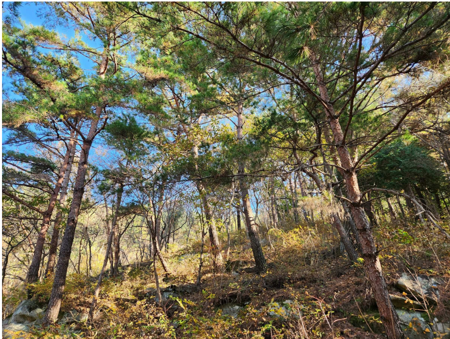
기호4 및 지상 수목의 상태 등