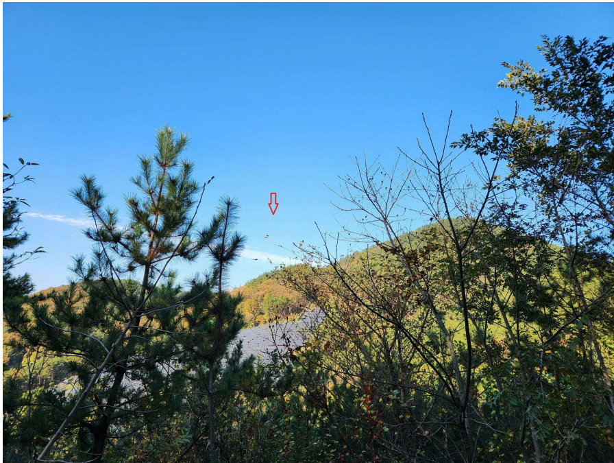
남측에서 북측을 향하여 원거리 촬영