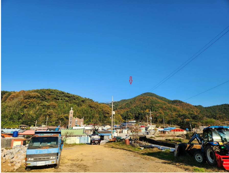
남서측에서 북동측을 향하여 원거리 촬영