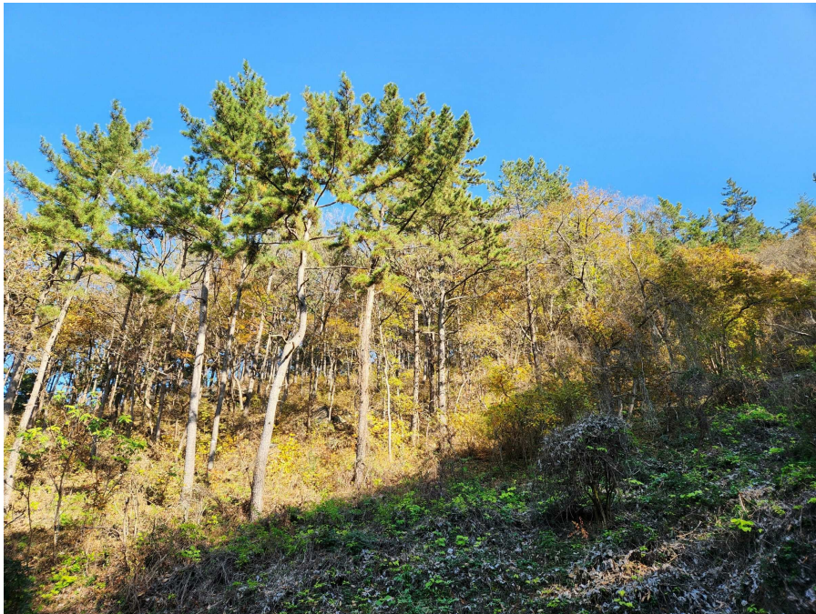
기호3 및 지상 수목의 상태 등