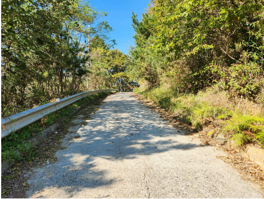
기호7 남동측에서 북서측을 향하여 촬영