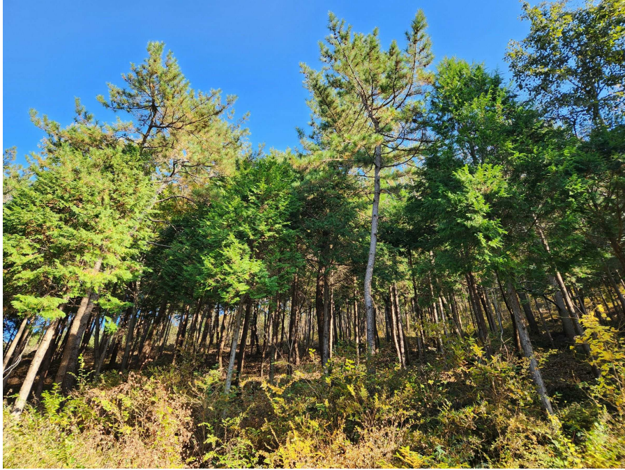
기호5 및 지상 수목의 상태 등