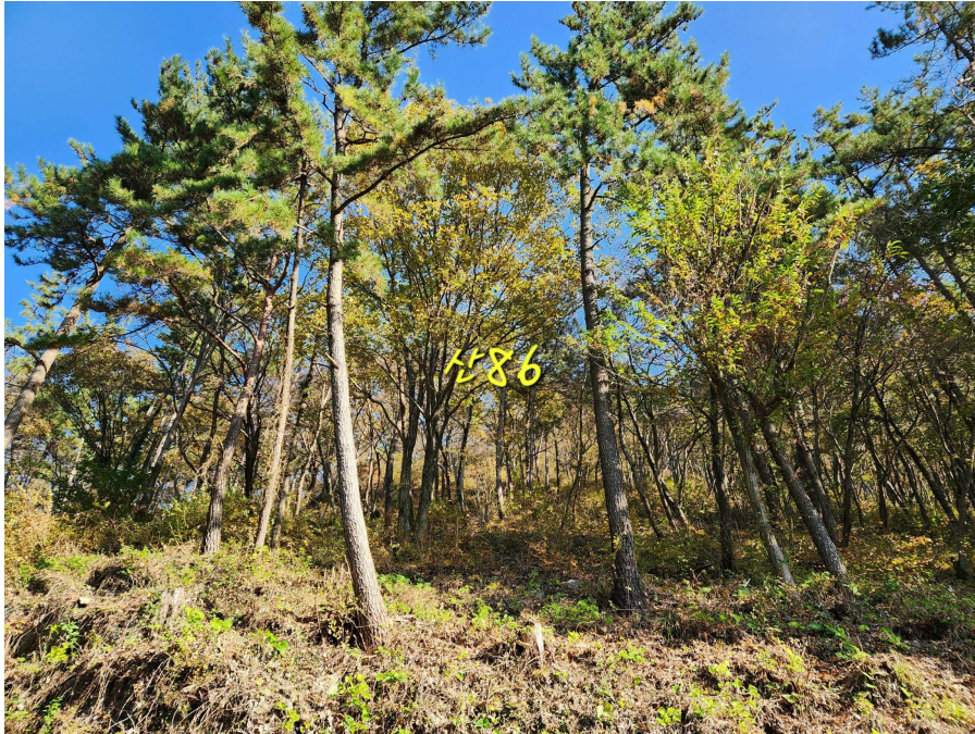
기호2 및 지상 수목의 상태 등