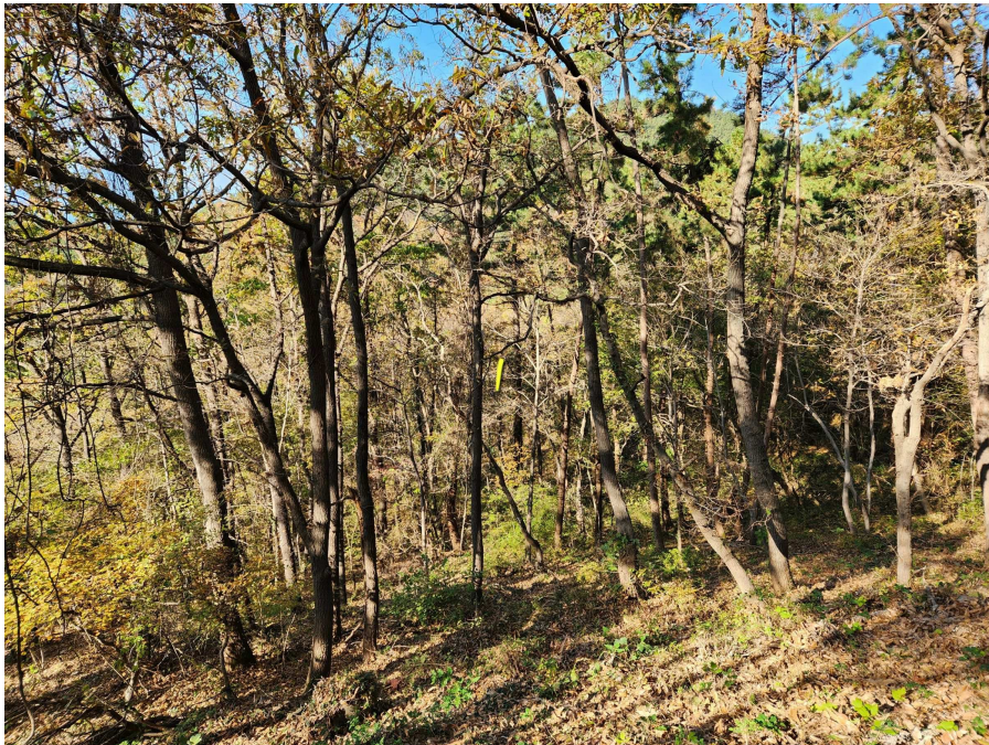
기호1 및 지상 수목 등의 상태