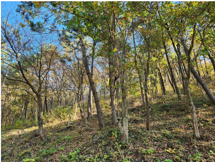
기호2 및 지상 수목의 상태 등