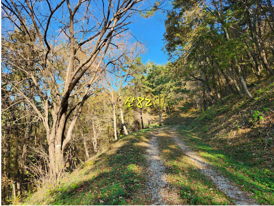
기호1 및 임도 등의 상태