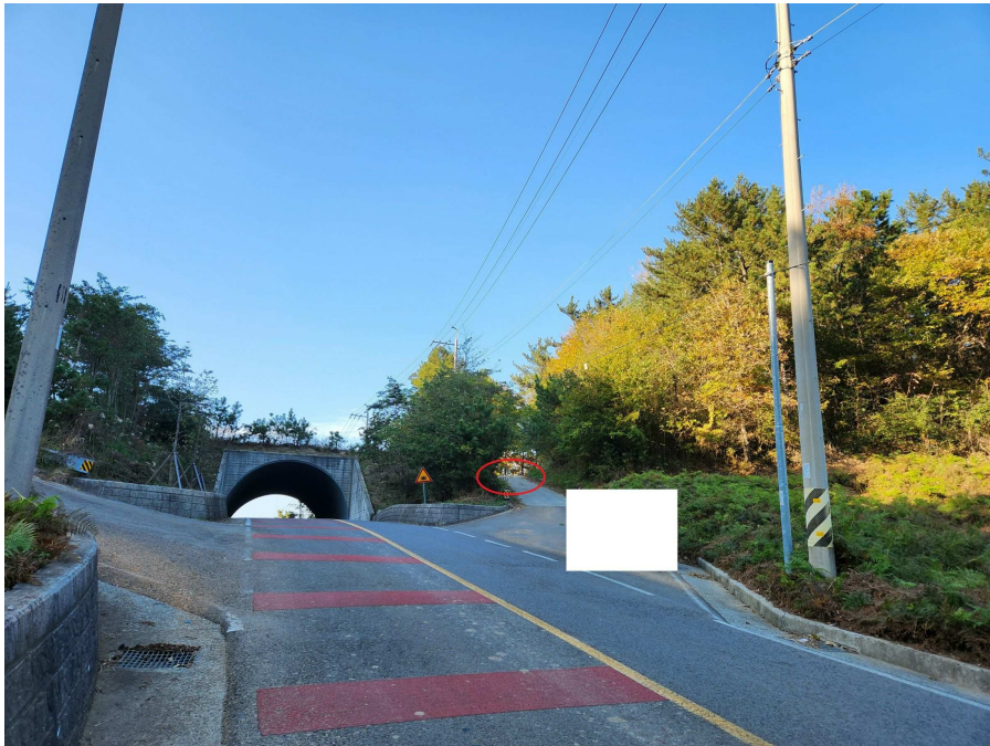
기호7 남동측에서 북서측을 향하여 촬영