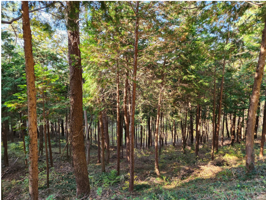
기호5 및 지상 수목의 상태 등