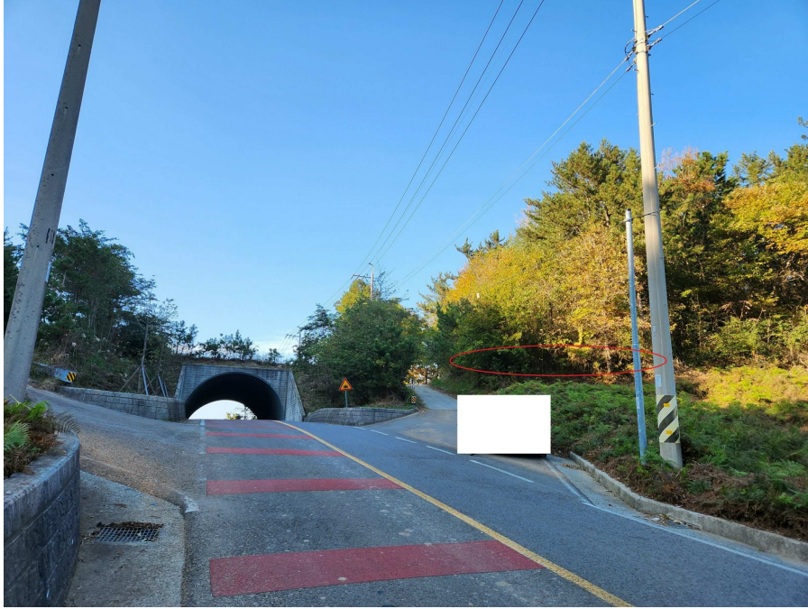
기호8 남동측에서 북서측을 향하여 촬영