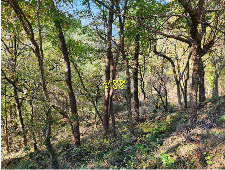
기호3 및 지상 수목의 상태 등