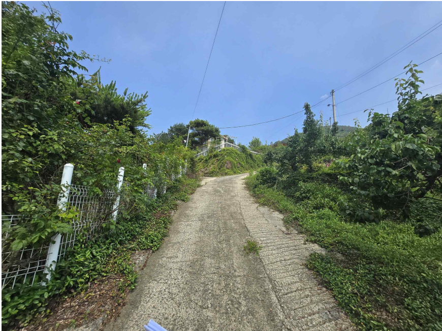
본건 전경, 남서측 인근에서 촬영