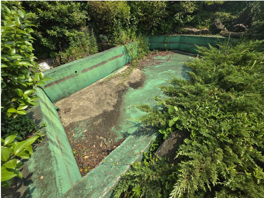
제시외수목 기호(a) 수경시설