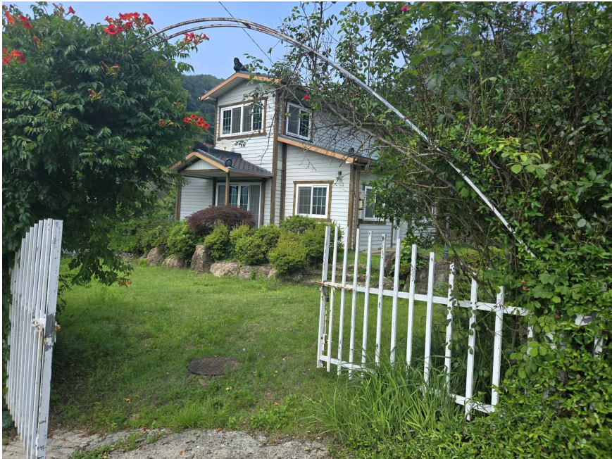
본건 전경사진, 본건 근접 촬영