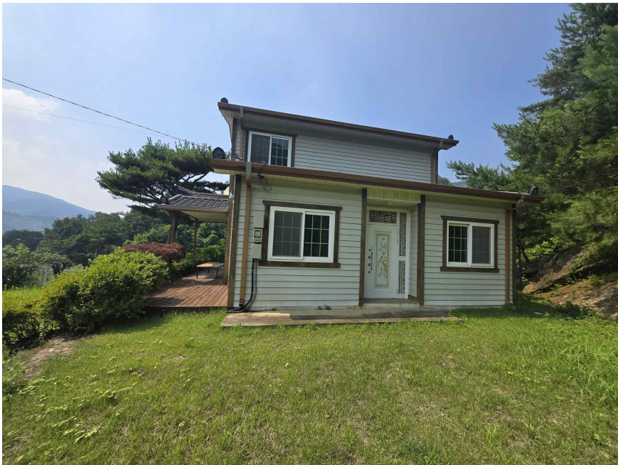
본건 건물 측면사진