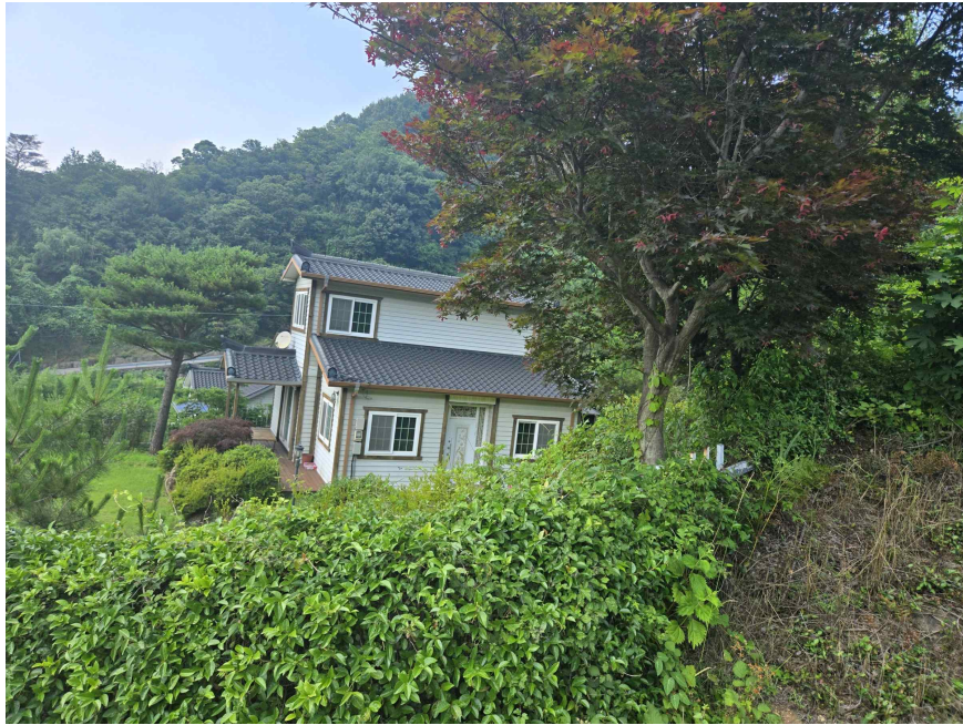
본건 전경사진, 동측 인근에서 촬영