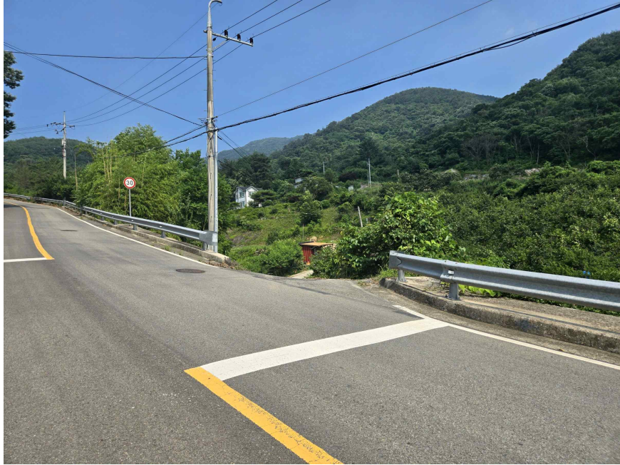
본건 소재 부근 전경, 서측 인근에서 촬영