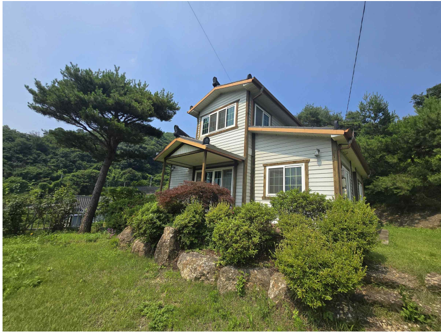
본건 건물 정면사진