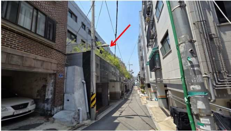
주위환경(본건 북서측 전경)