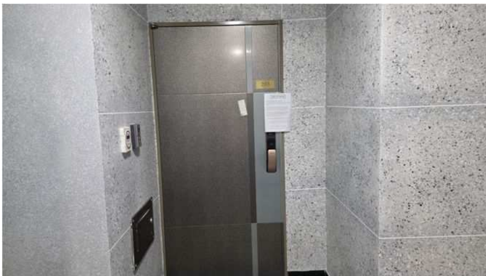
본건 제1층 제203호