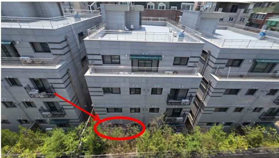
본건 전경 제비동 제1층 제203호(본건 북측에서 촬영)