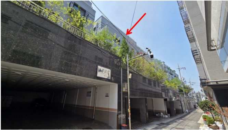
본건이 속한 건물 제비동(본건 북동측에서 촬영)