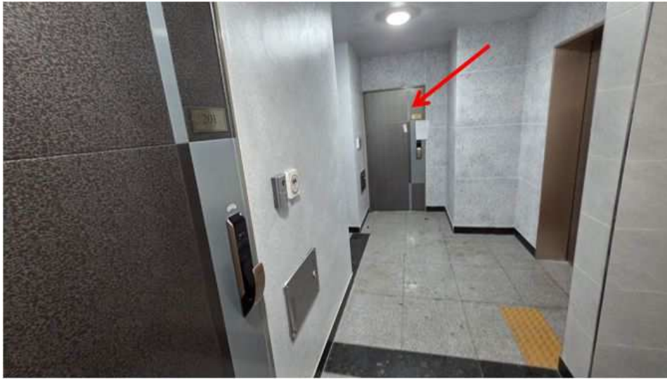
제1층 복도 전경