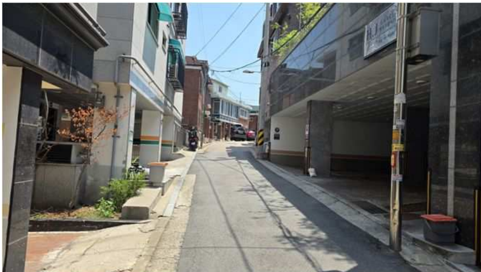
주위환경(본건 북동측 전경)