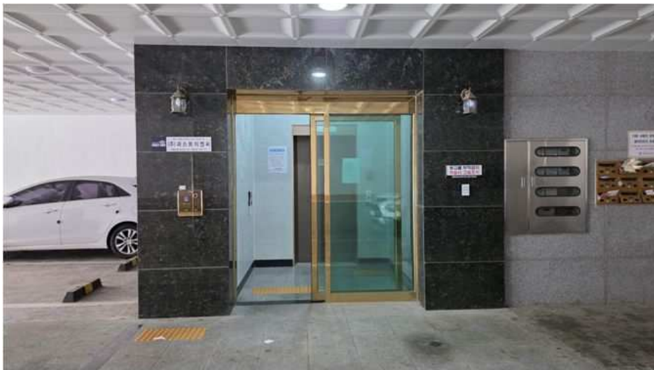
공부상 지하1층 소재 주 출입구