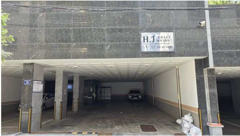
공부상 지하1층 주차장 전경