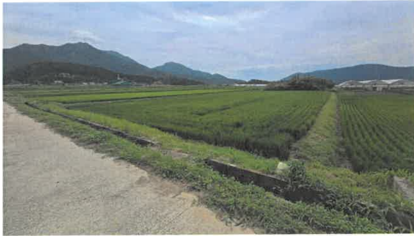
본건(1) 및 주위 전경