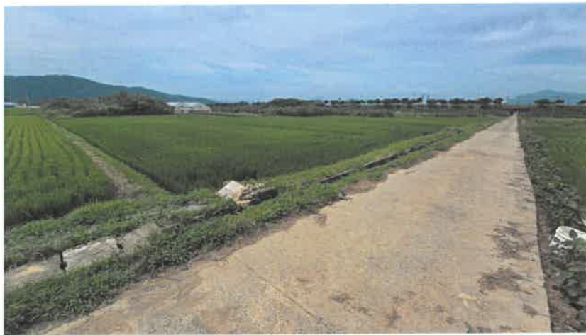
본건(1) 및 주위 전경