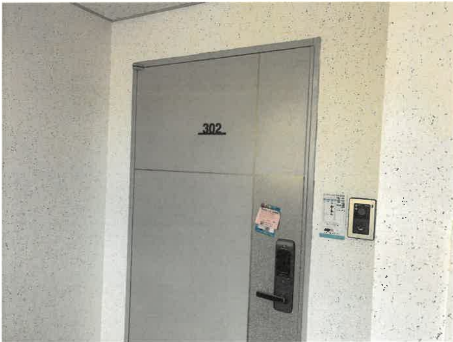
본건 호 전경