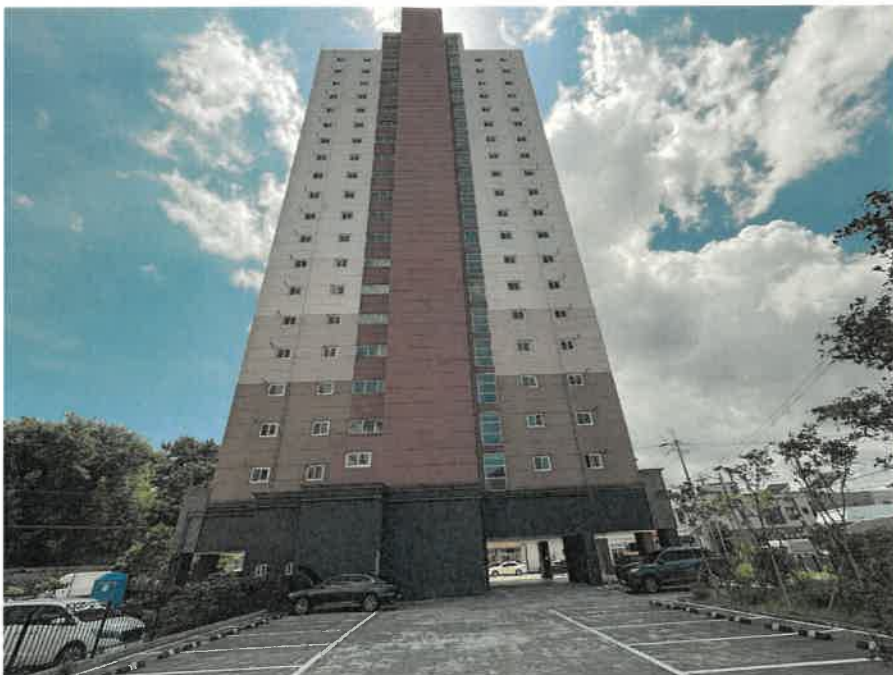
후면 및 주차장