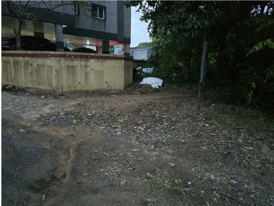
( 2 )