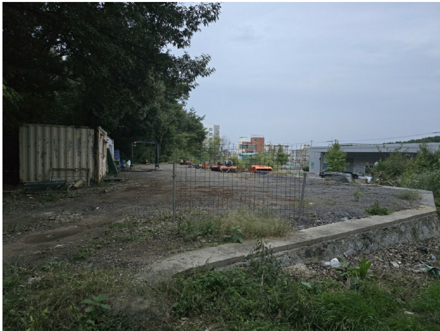
( 3 )