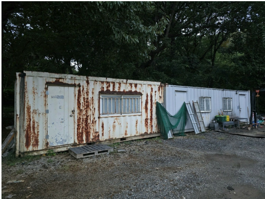
( 3 )