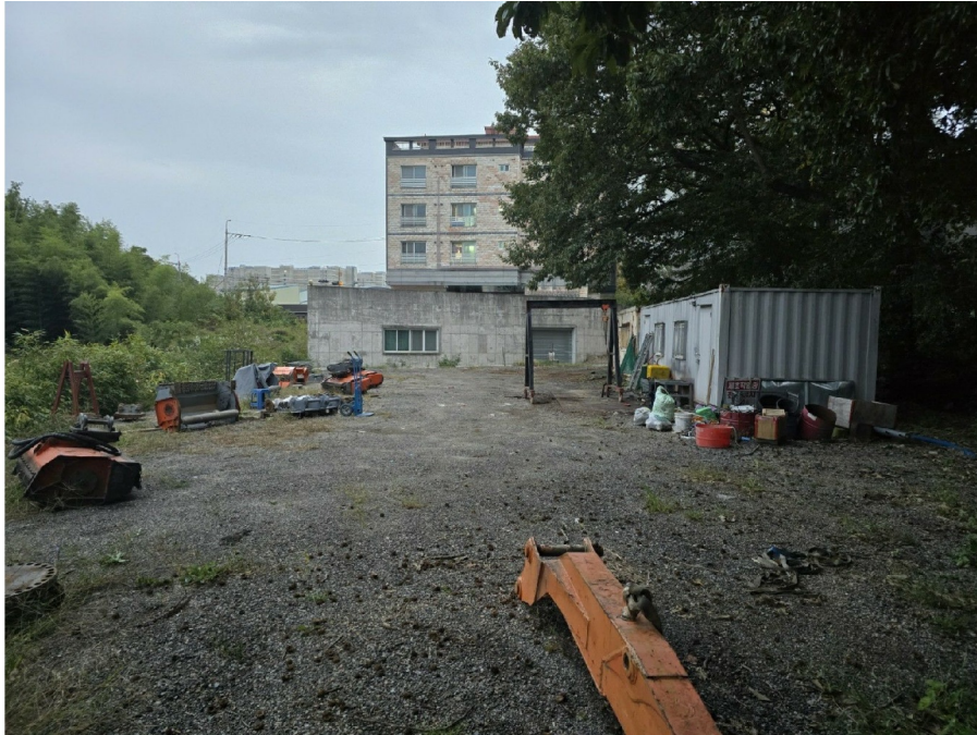
( 3 )