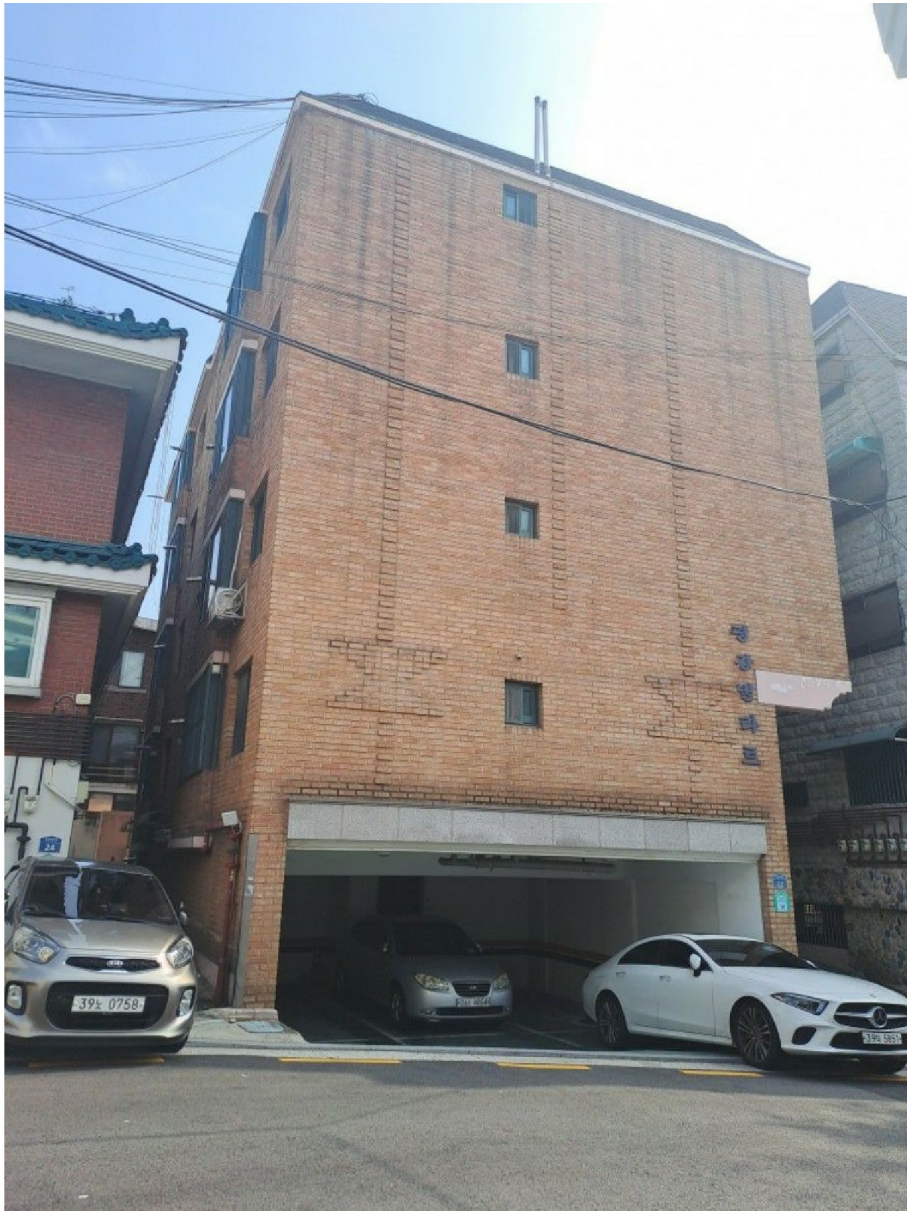
[ 1 ]