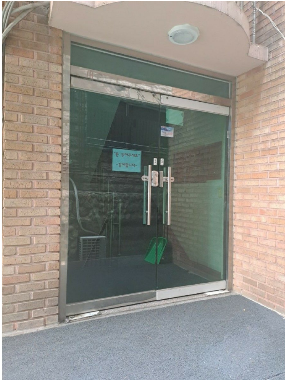
[ 1 ]