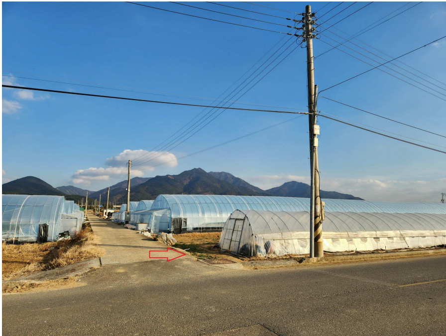
북측으로 접면하고 있는 농로 및 동측 부근의 상황 등