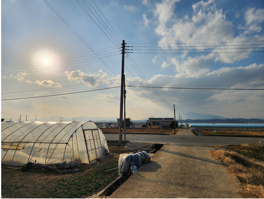
북측 경계부근에서 서측으로 바라보이는 조망 등 서측 부근의 상황