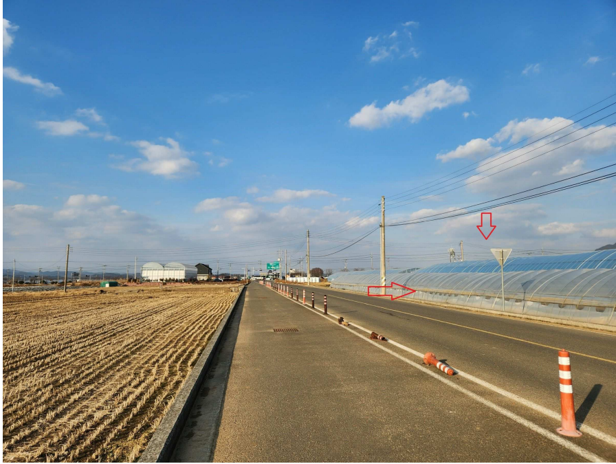
서측으로 접면하고 있는 도로 및 북측 부근의 상황 등