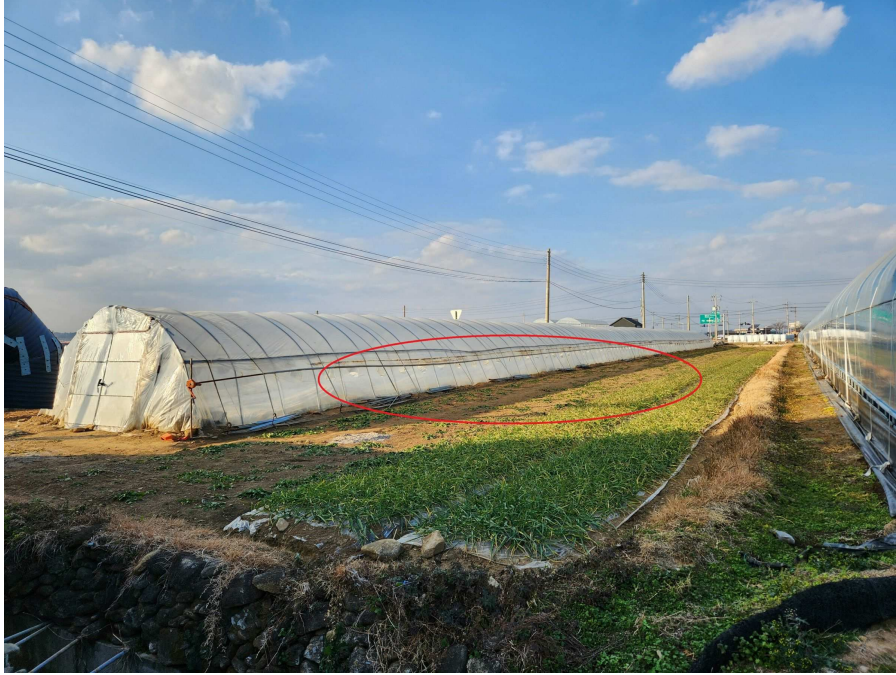
본건의 전경 남동측에서 북서측을 향하여 촬영