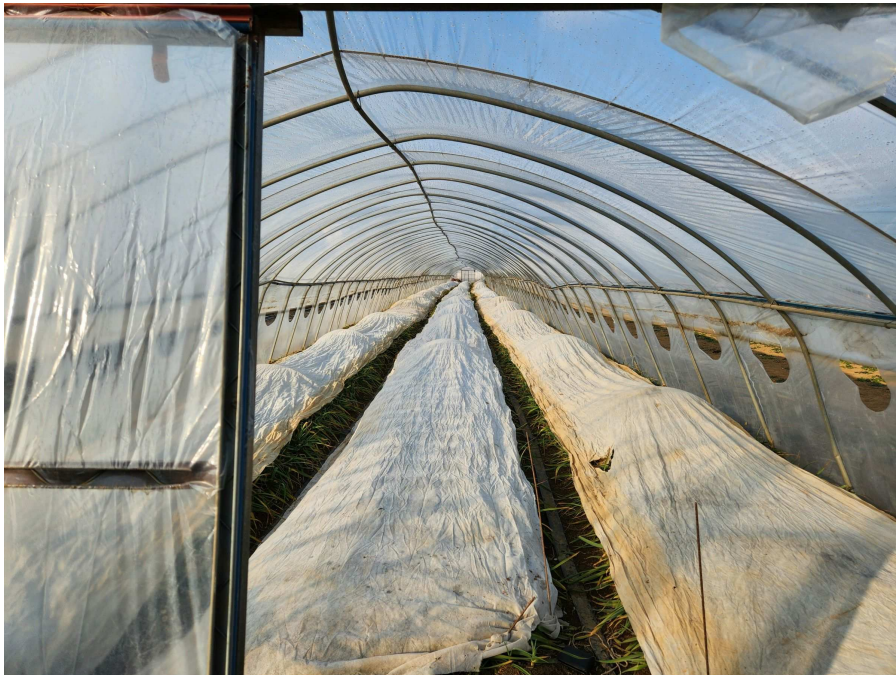
제시외 물건 기호ㄱ (비닐하우스) 등