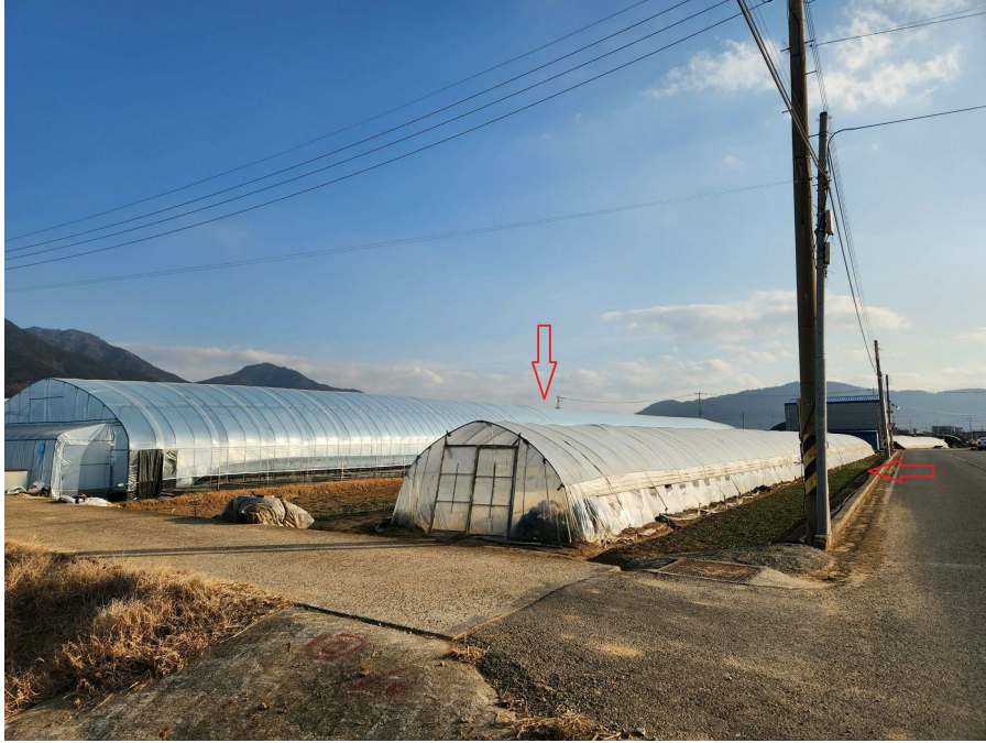
본건의 전경 북서측에서 남동측을 향하여 촬영