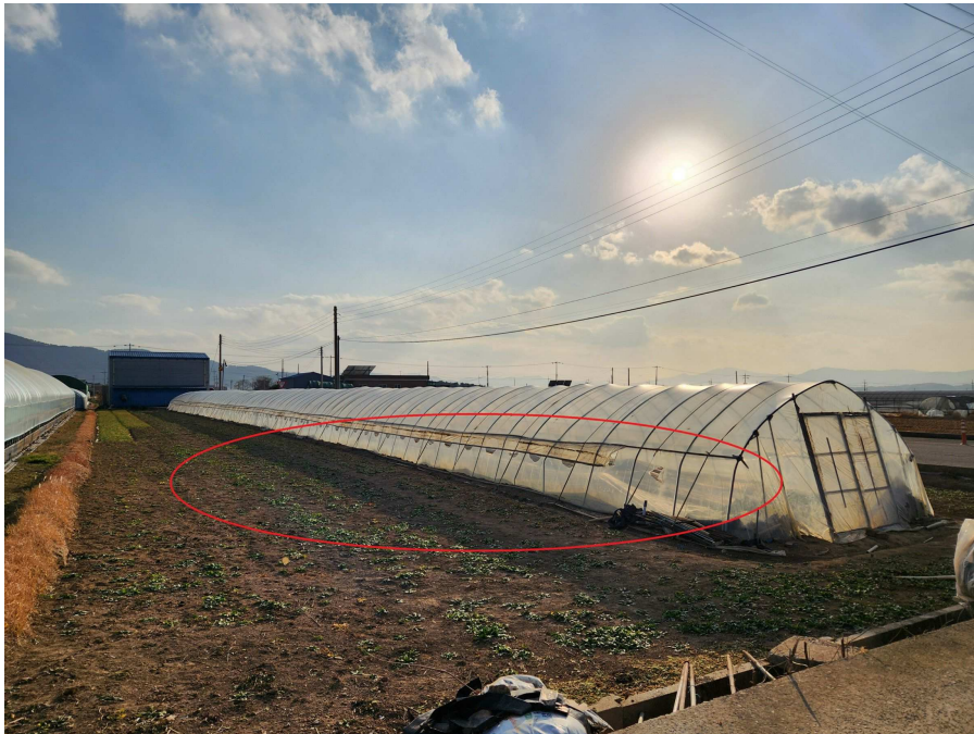
본건의 전경 북동측에서 남서측을 향하여 촬영