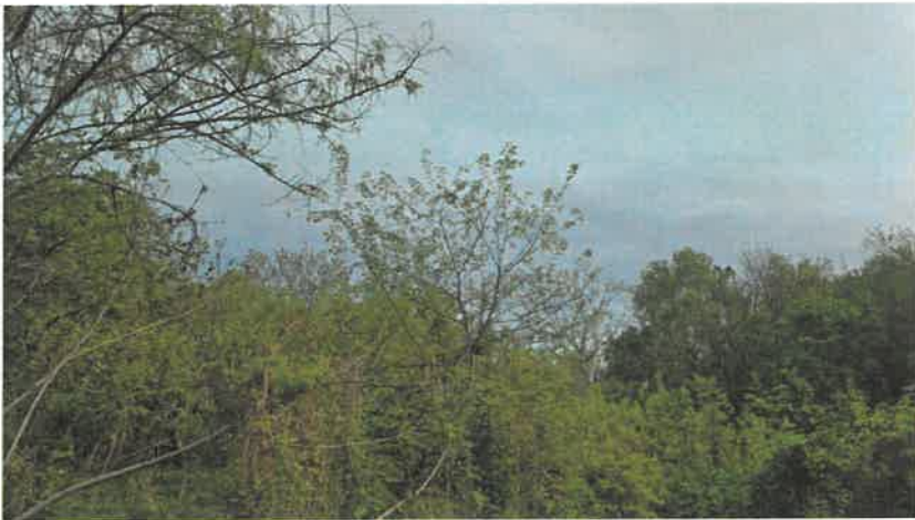
본건 및 주위 전경