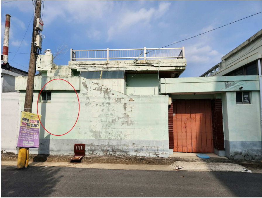
기호2-1 외부상황 서측에서 동측을 향하여 촬영