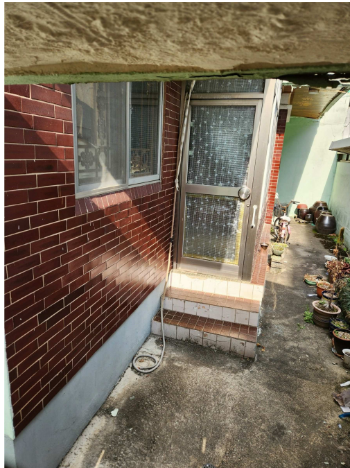
기호2 건물의 전경