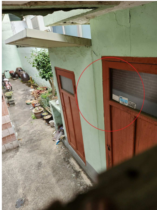
종물 및 부합물 기호 ㄱ