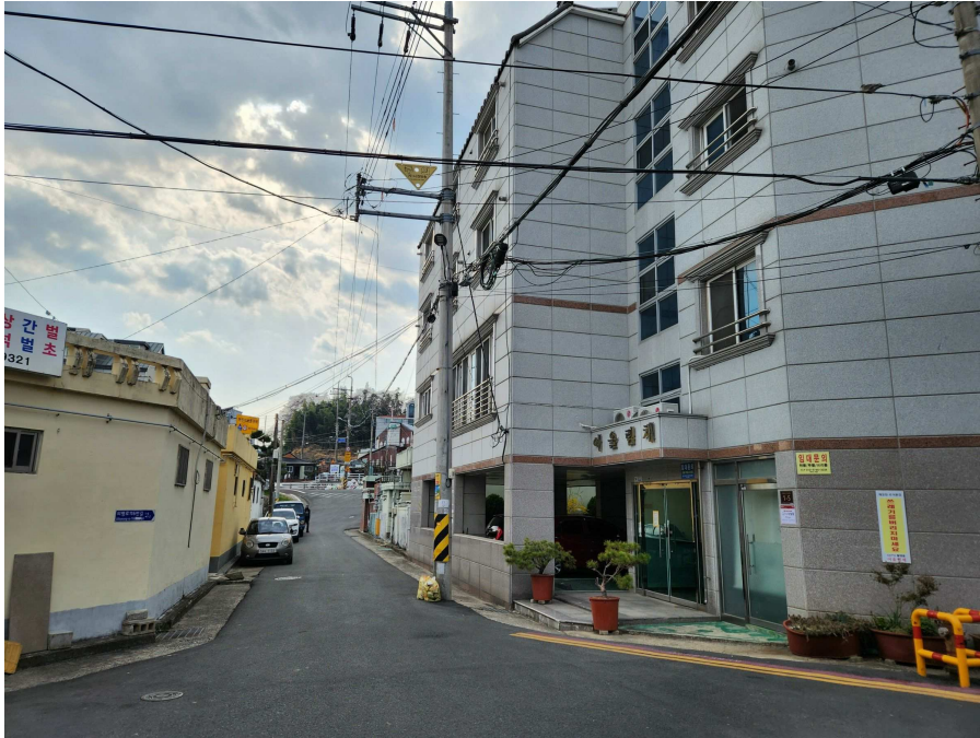
부근의 상황 등 동측에서 서측을 향하여 촬영