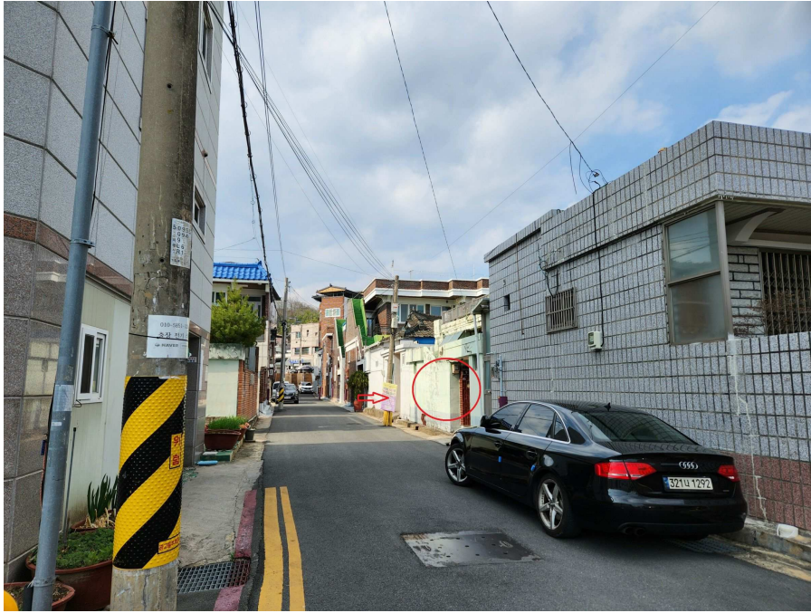
본건의 전경 남측에서 북측을 향하여 촬영