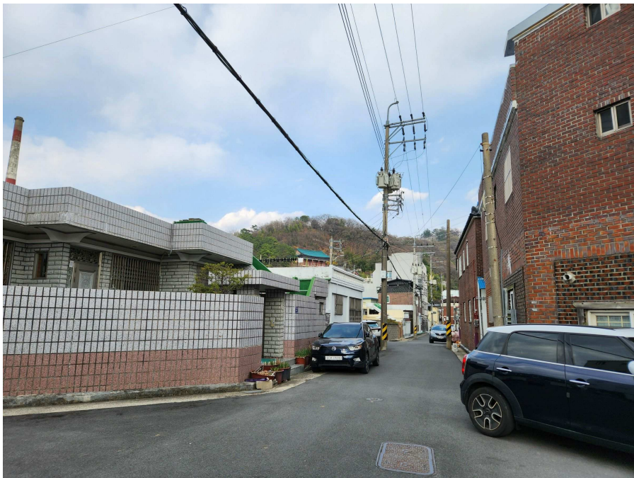
부근의 상황 등 서측에서 동측을 향하여 촬영