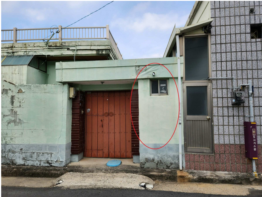
좁음 및 부합물 기호2-1의 외부상황 등 서측에서 동측을 향하여 촬영