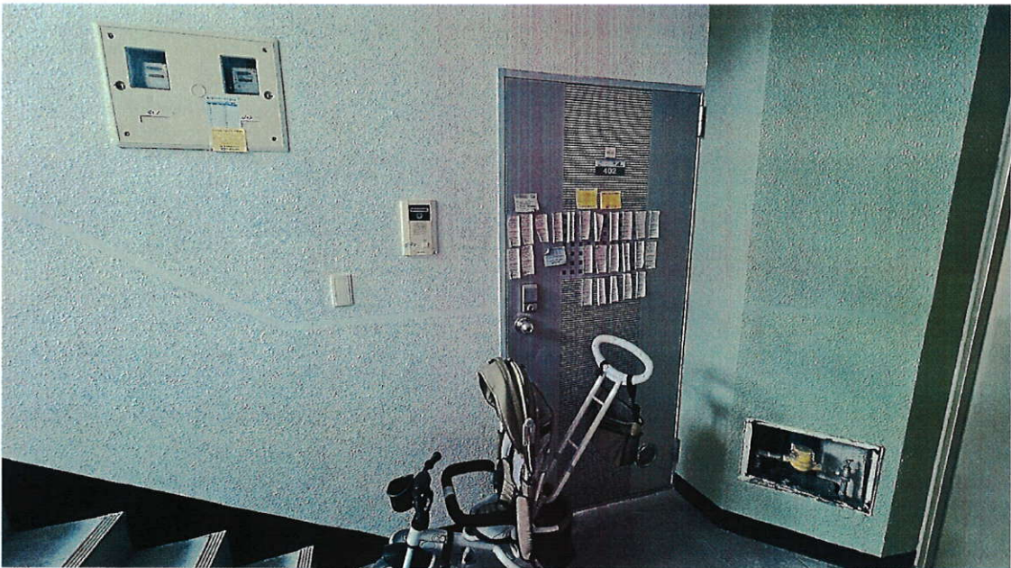
본건 구분건물 사진