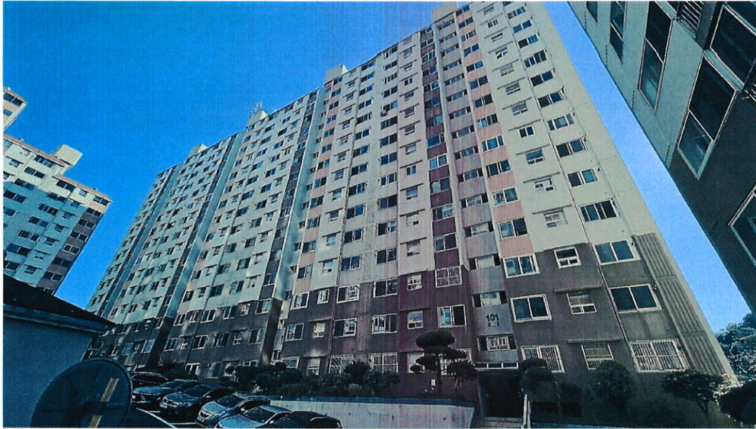
본건 건물 사진