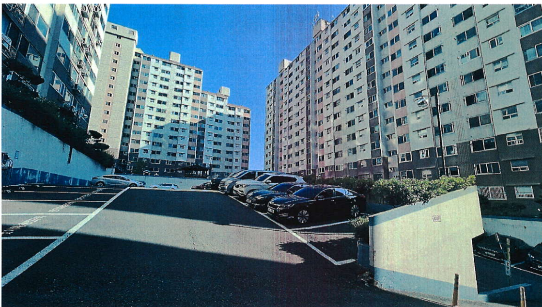
본건 단지 사진