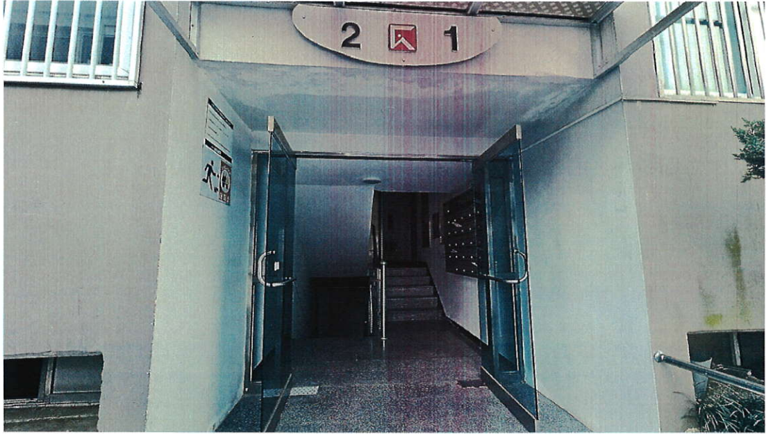
본건 건물 출입구 사진