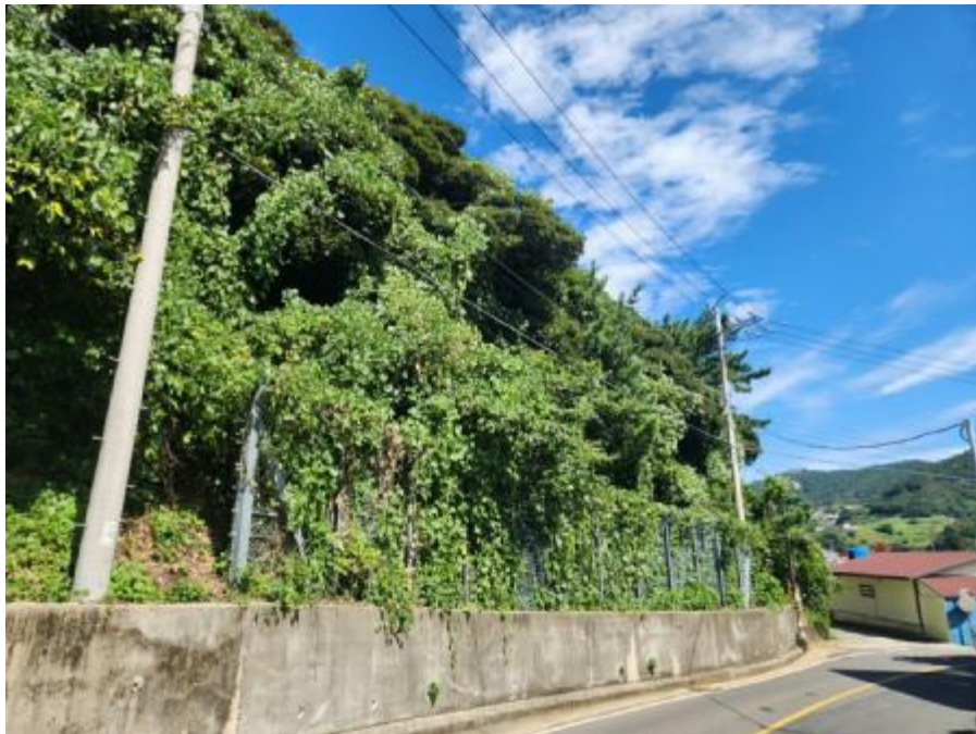
기호 1) 서측 전경