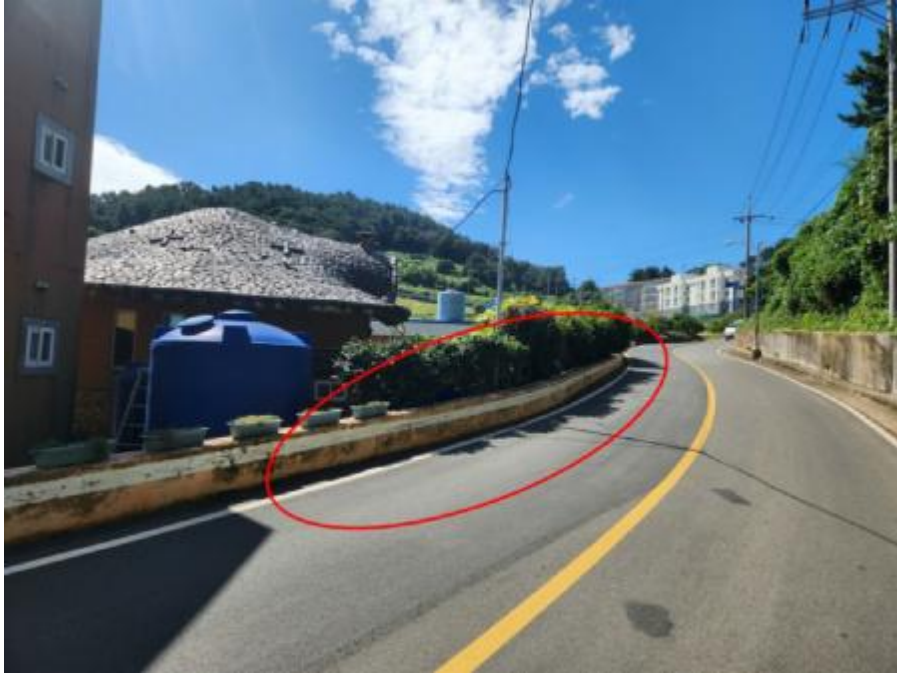
기호 2) 동측 전경