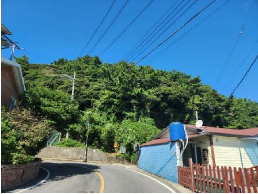
기호 1) 남측 전경