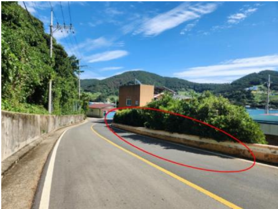
기호 2) 서측 전경