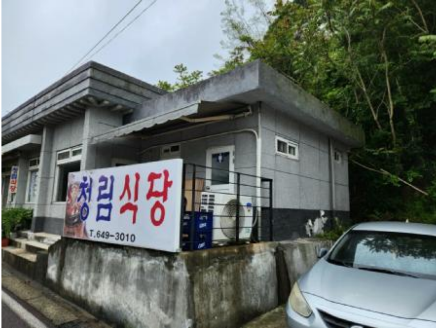
제시외 건물 ㄱ)