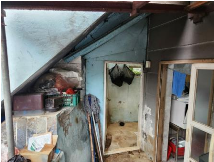
제시외 건물 ㄴ)