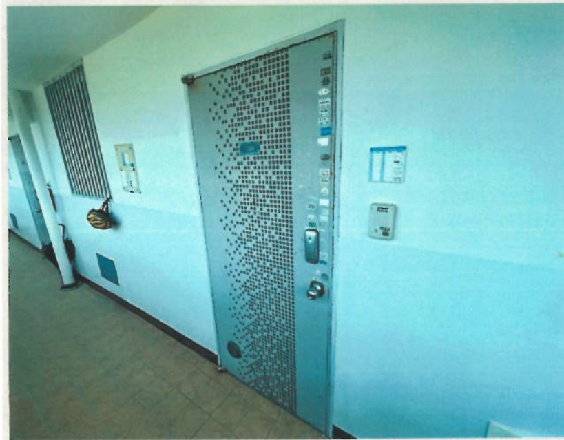
【2. 본건 기호(1) 현관문 전경】