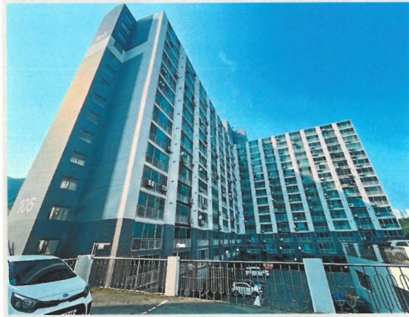
【1. 본건 건물 전경】