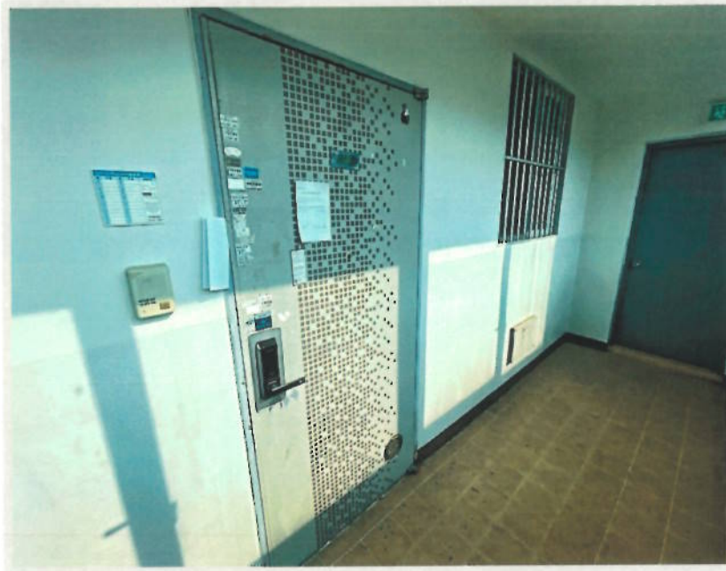
【4. 본건 기호(3) 현관문 전경】