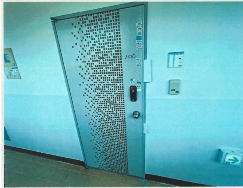
【3. 본건 기호(2) 현관문 전경】