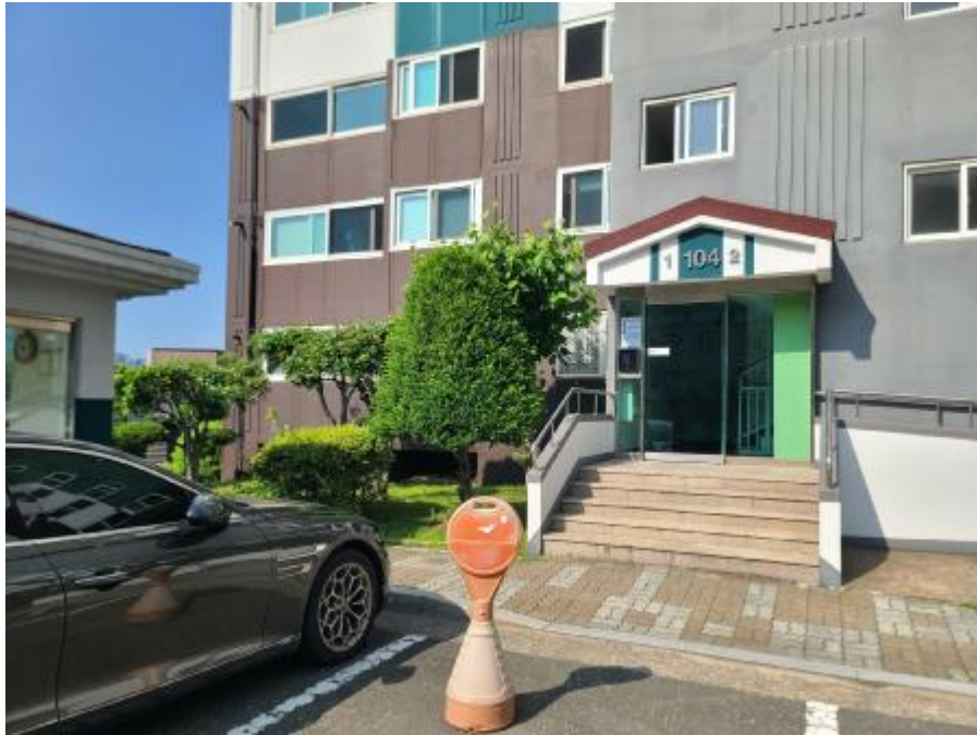
본건 및 공동현관