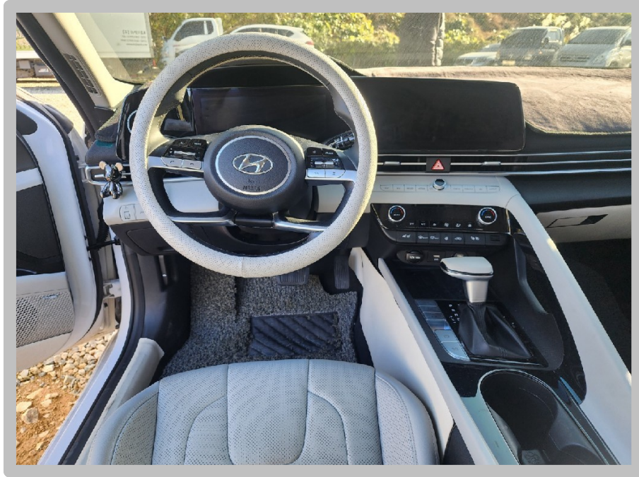
【 본건 자동차 내부 】