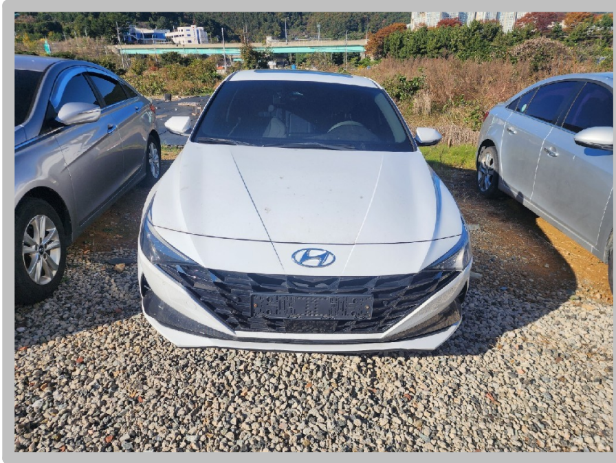
【 본건 자동차 】