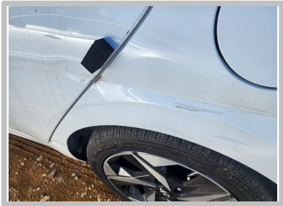
【 찌그러짐 소재부분 】