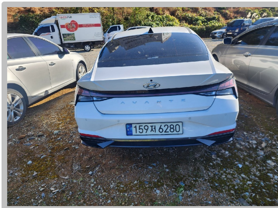
【 본건 자동차 】