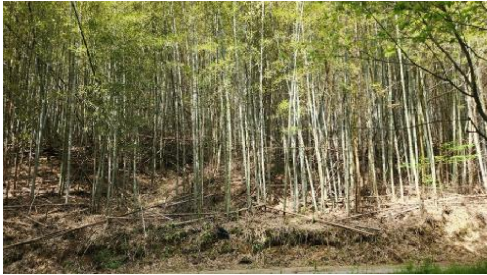
대상 토지 내