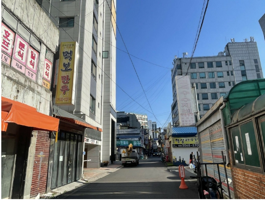
본건 소재 건물 서측 주위환경