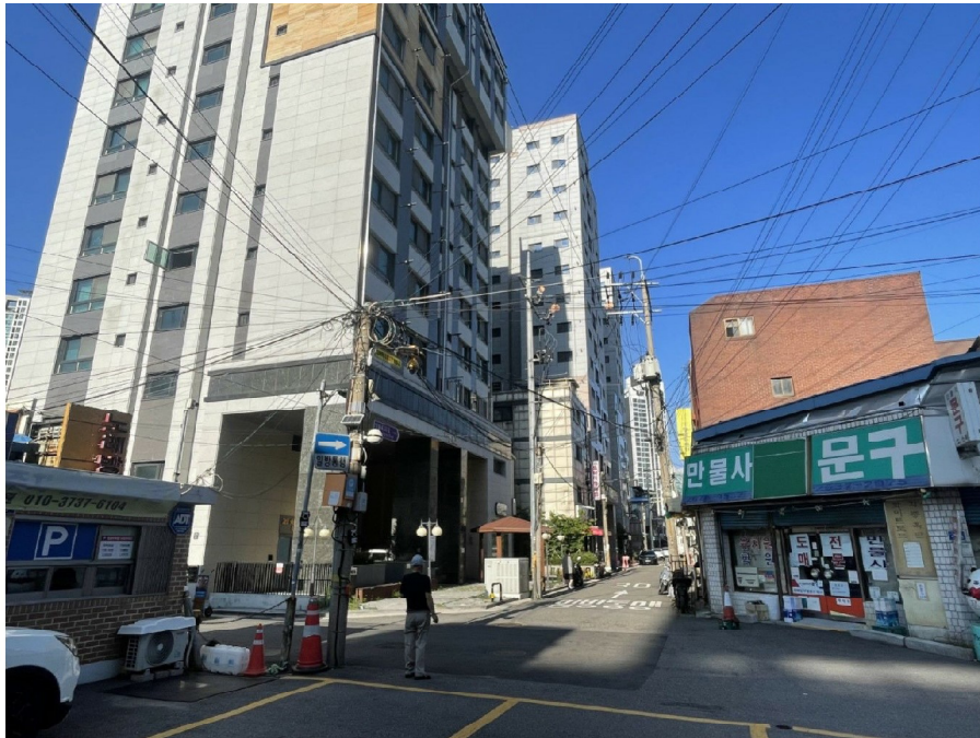
본건 소재 건물 남측 주위환경