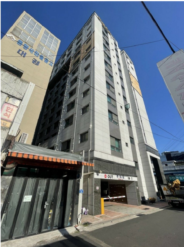
본건 소재 건물 북서측 전경