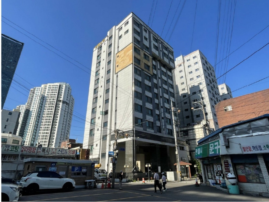
본건 소재 건물 전경 및 주위환경