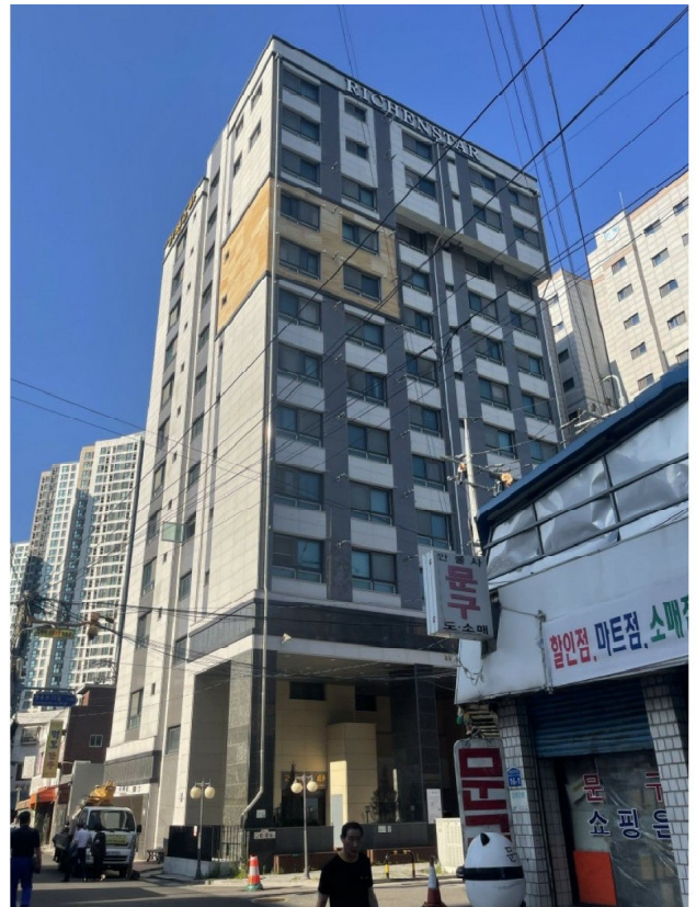
본건 소재 건물 남서측 전경