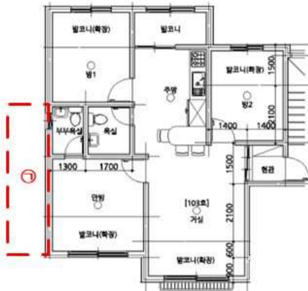
[ 내 부 구 조 도 ]