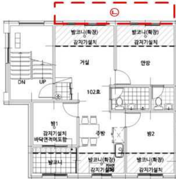
[ 내 부 구 조 도 ]