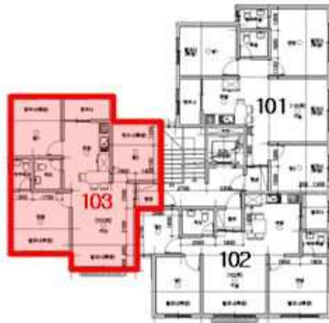
[ 호 별 배 치 도 ]