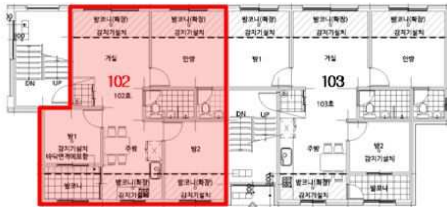
[ 호 별 배 치 도 ]