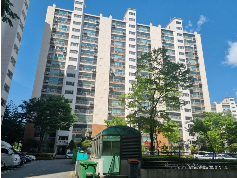
본건 전경 : 동측에서 촬영