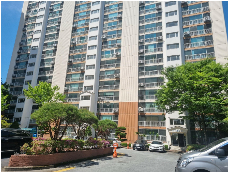
본건 전경 : 북동측에서 촬영