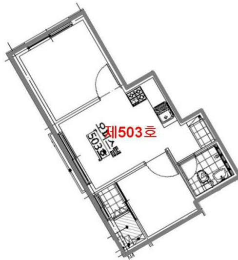
【 내부구조도 】

본건을 방문하였으나 점유인이 폐문·부재하여, 본건의 내부구조 및 이용상황 등은 건축물현황도 및 외부관찰 등에 근거하여 표시하였는 바 현황과 다소 상이할 수 있으니 참조바랍니다.