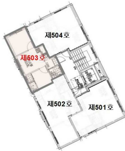
【 호별배치도 】