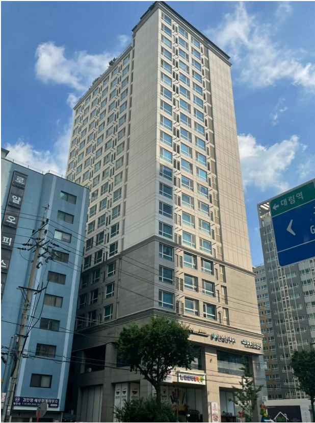
본건이 속한 건물 전경