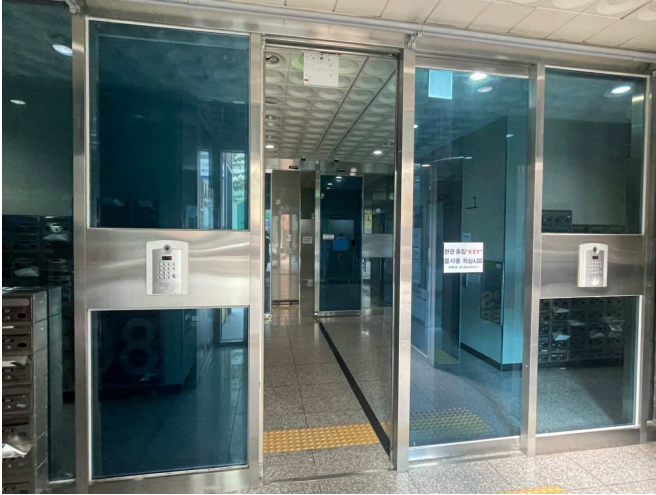
본건 건물 공용출입구