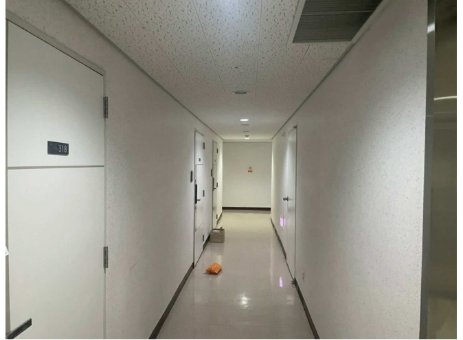
본건 건물 3층 복도