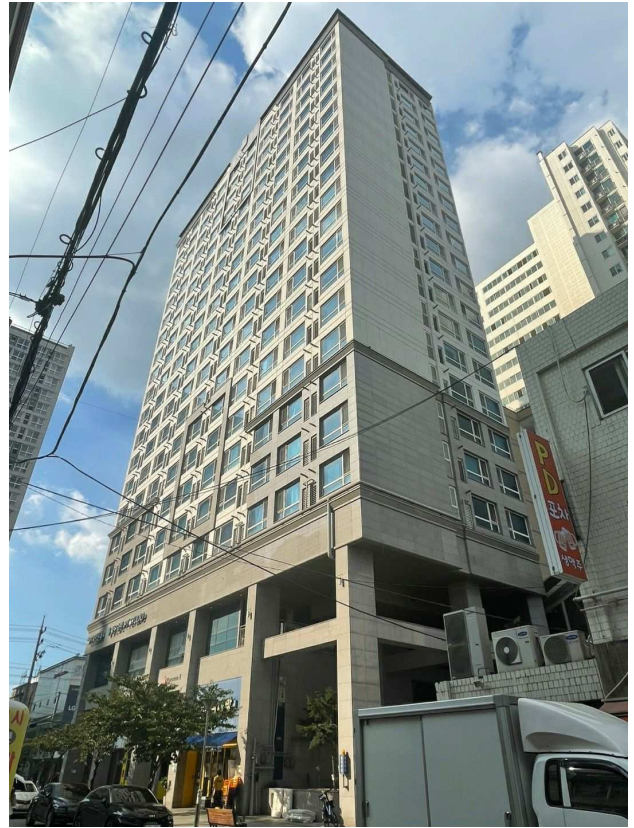
본건이 속한 건물 전경