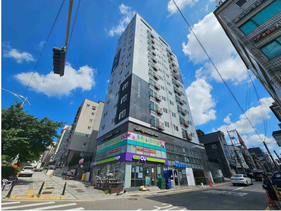
본건 소재 건물 전경