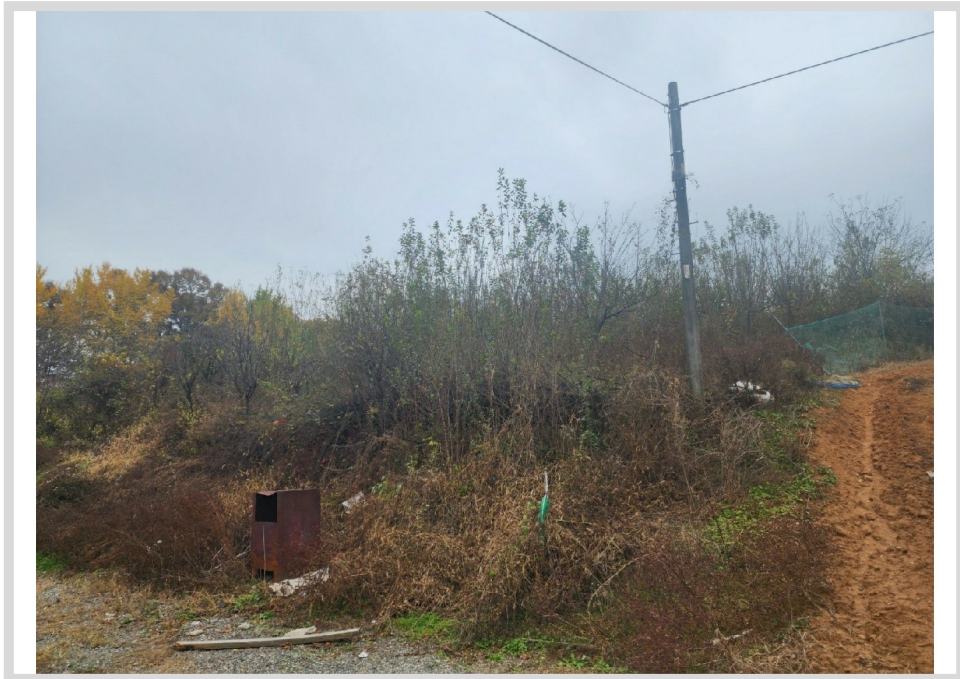
[ (2) ]