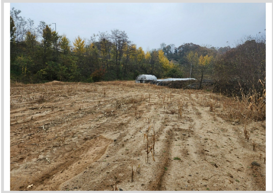
[ (6) ]