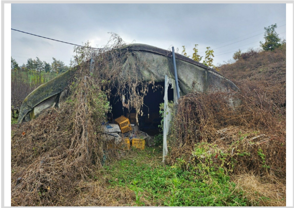
[ (3) ]