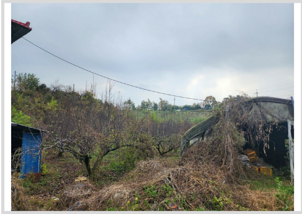
[ (3) ]