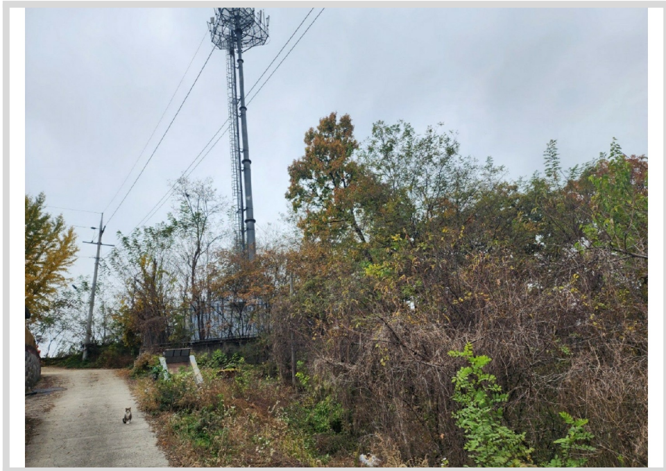
[ (4) ]