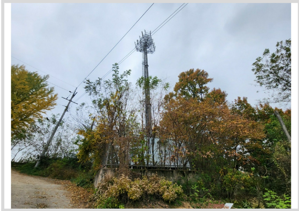
[ (4) ]