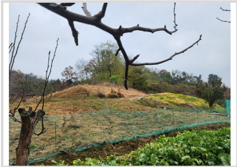
[ (5) ]