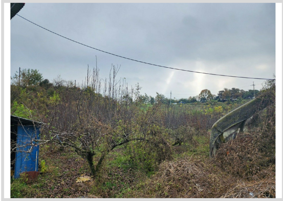
[ (3) ]