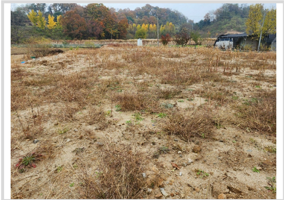
[ (7) ]