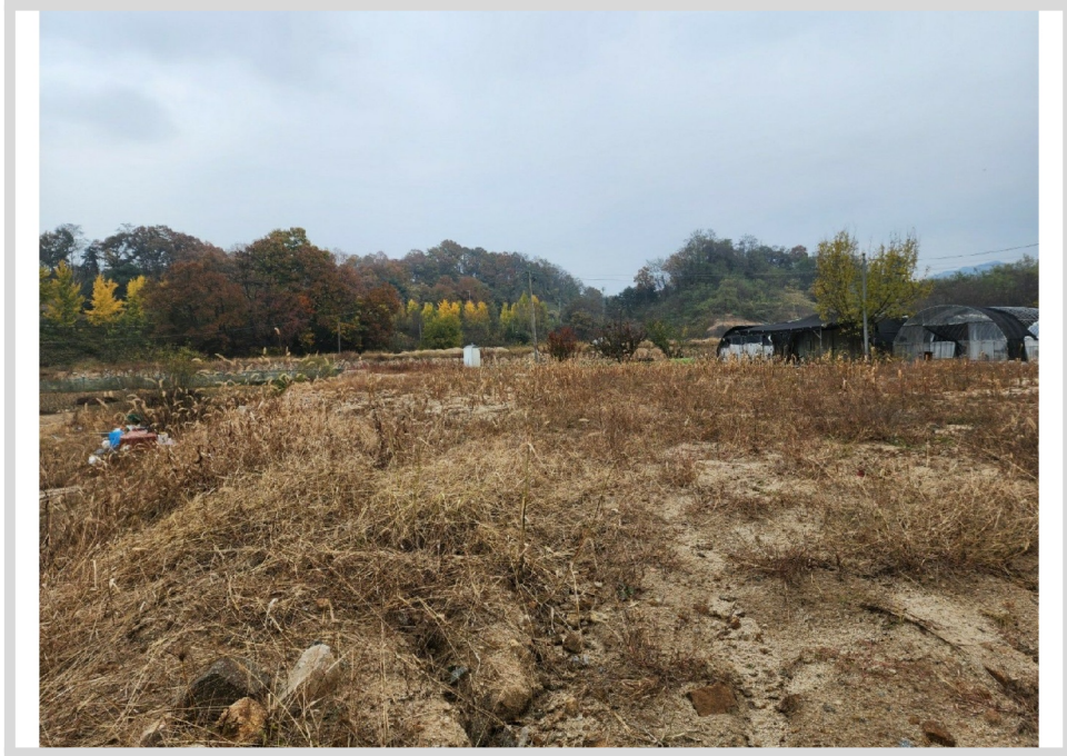
[ (1) ]