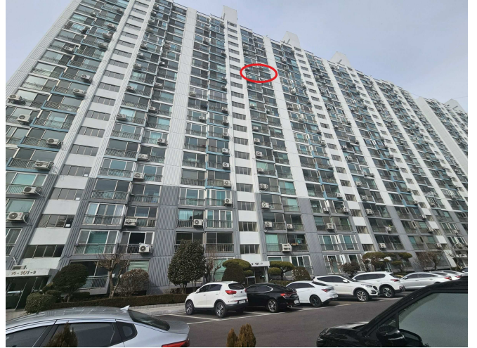
본건 (남측에서 촬영)