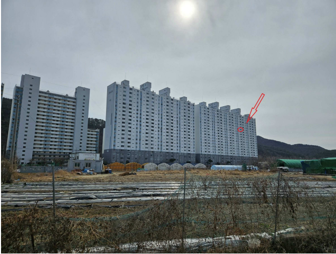
본건 (북측에서 촬영)