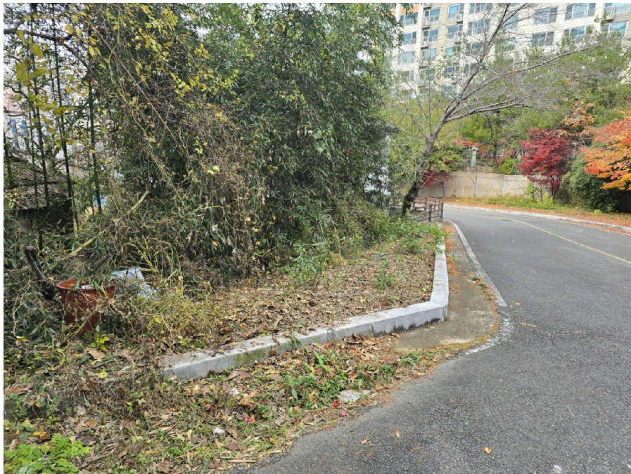
( 5 )