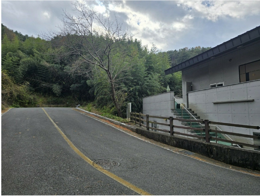
( 5 )