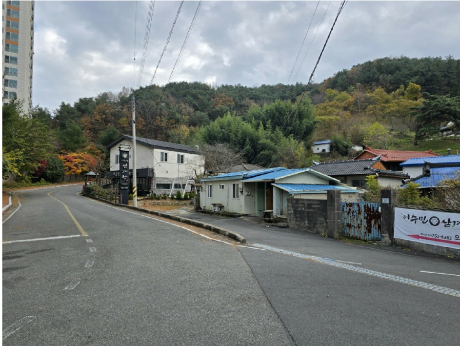
( 2 )