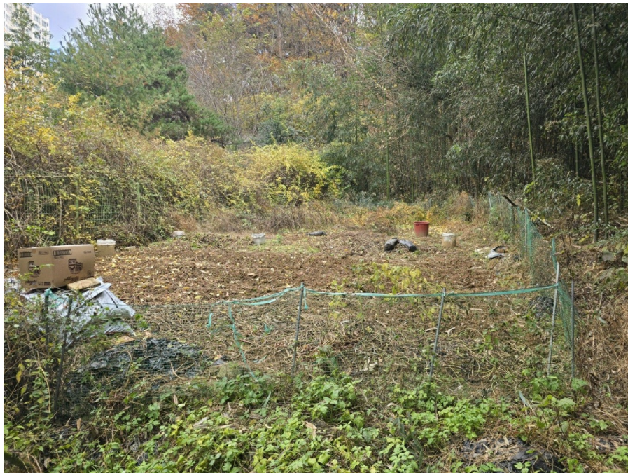
( 6 )