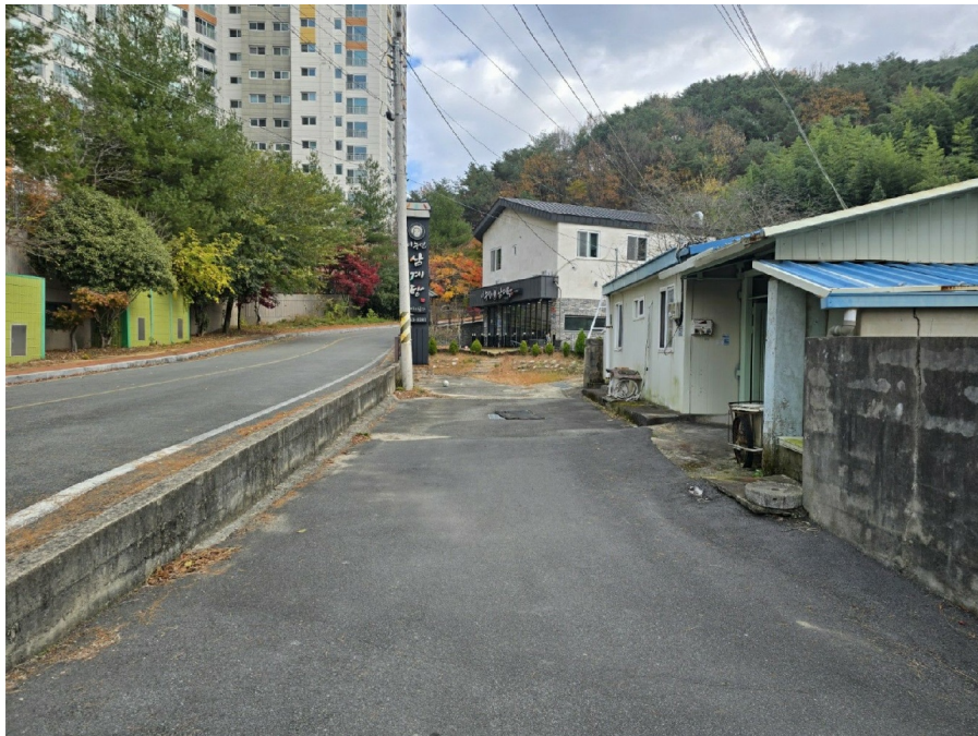
( 2 )