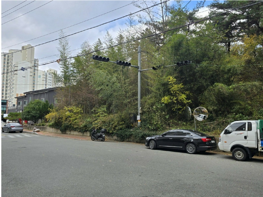
( 3 )