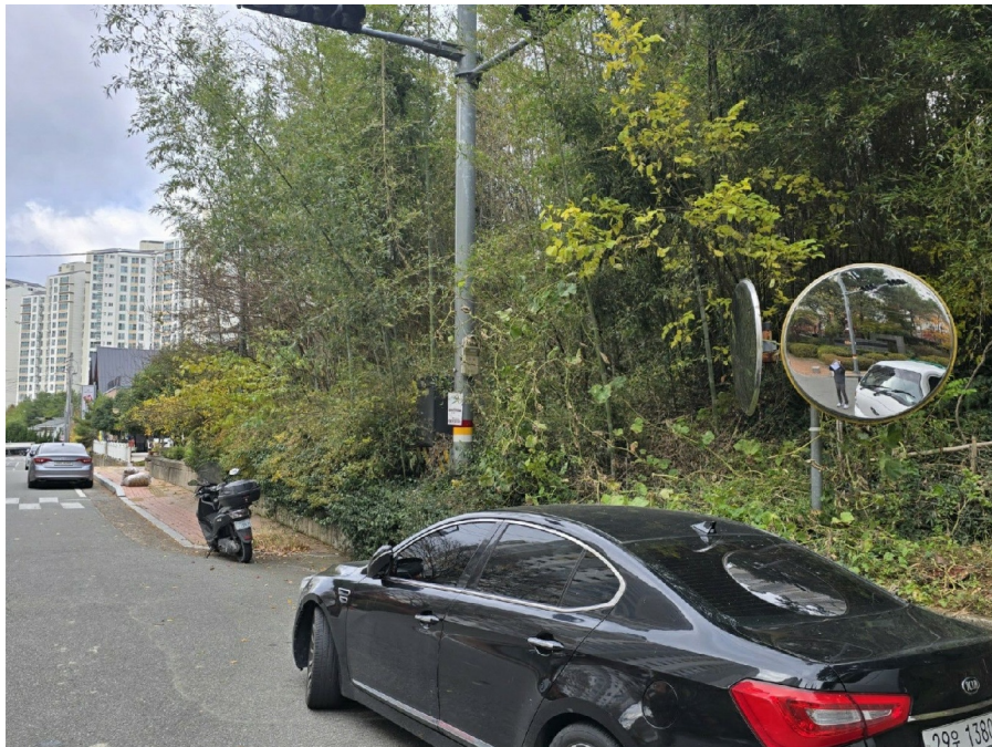
( 3 )