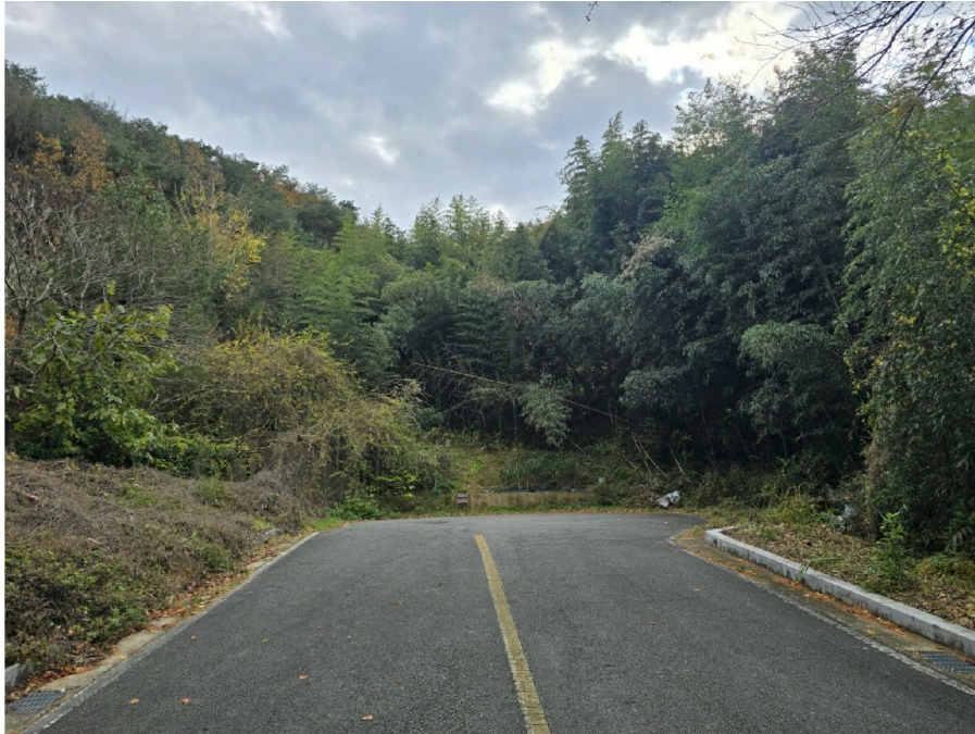
( 6 )