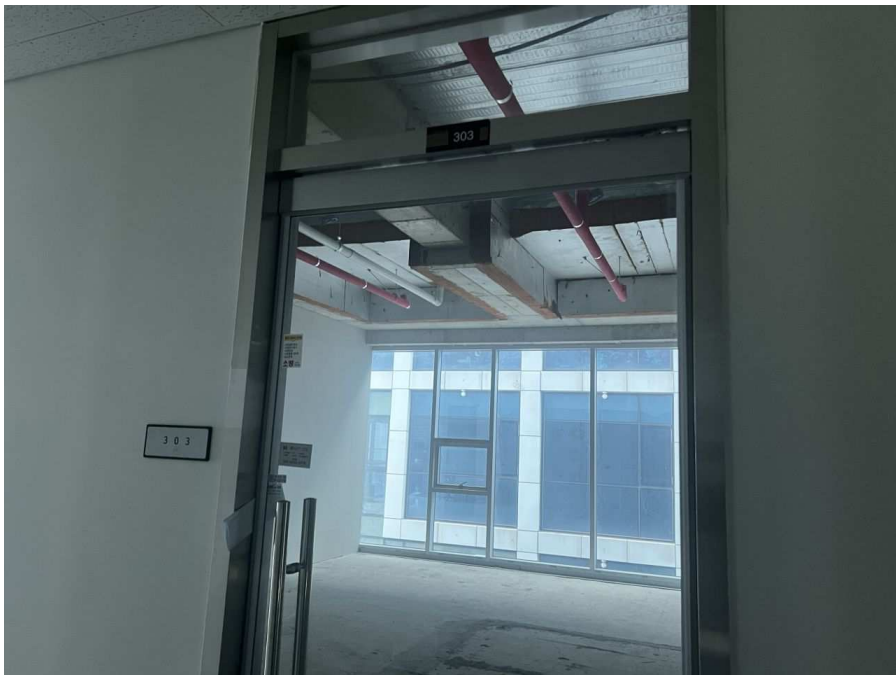
303호 (기호 2)