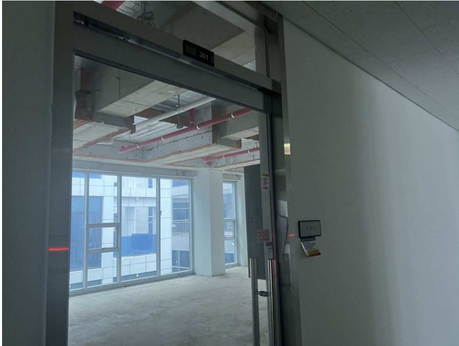
301호 (기호 3)