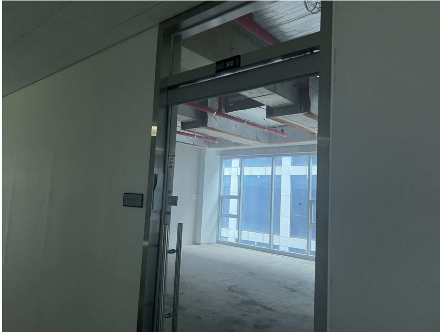
302호 (기호 1)