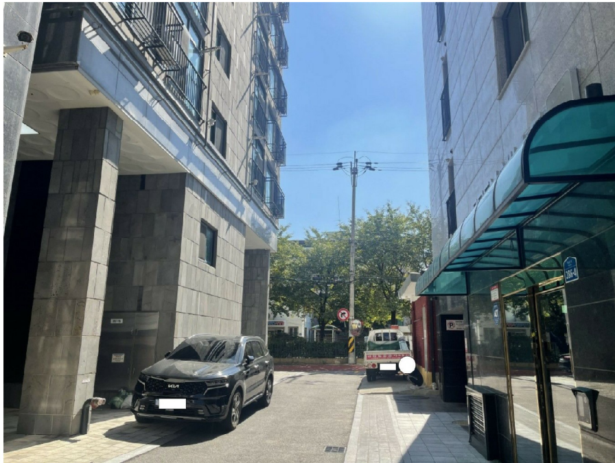
본건 서측 주위환경