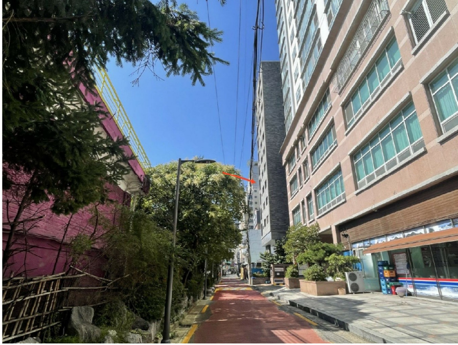
본건 동측 주위환경