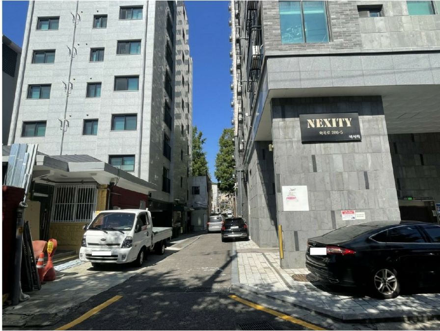
본건 남서측 접면도로