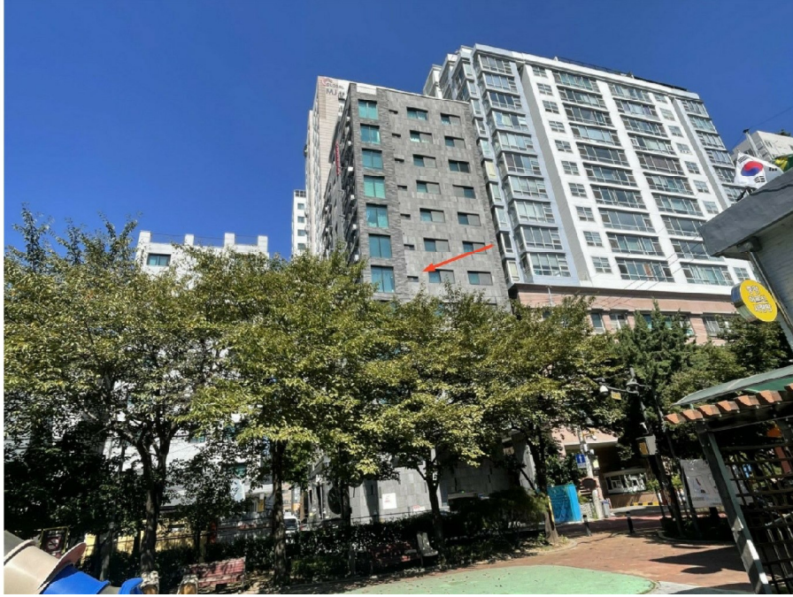
본건 남동측 전경