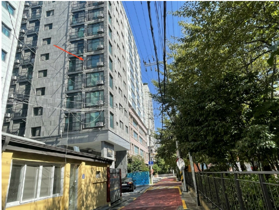
본건 남서측 전경