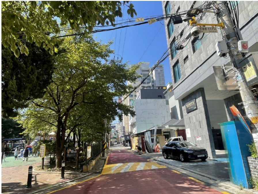
본건 남측 주위환경