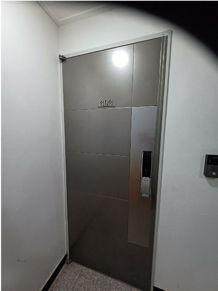
( 303 )