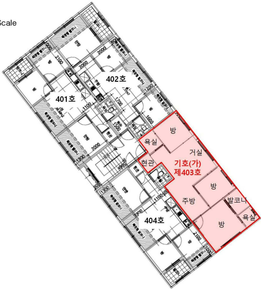
< 제4층 호별배치도 및 내부구조도 >