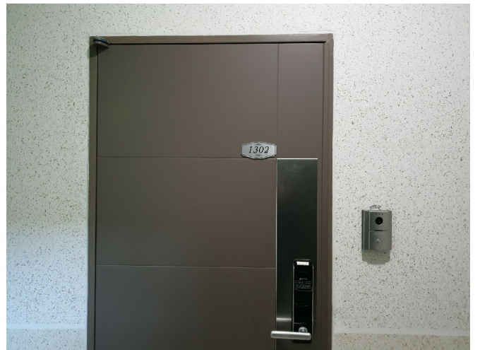
( 1302 )