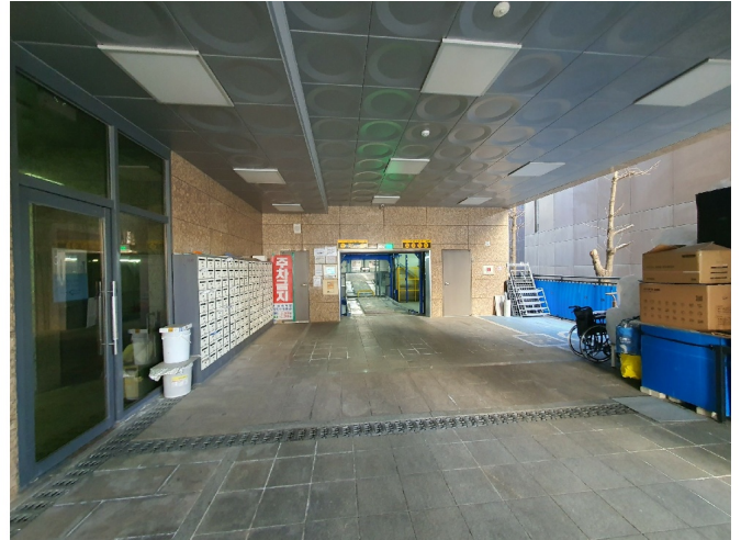
( 1 )