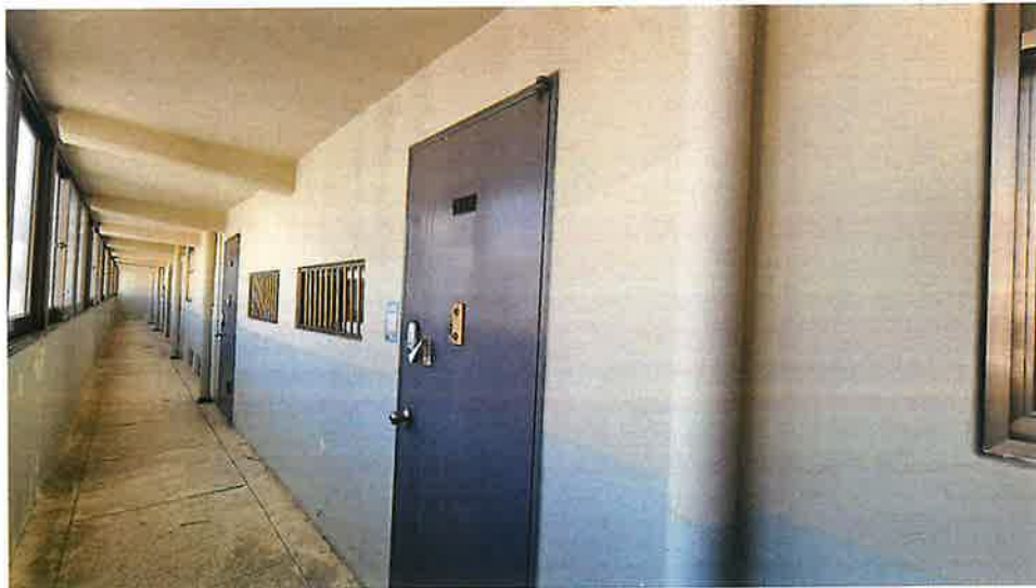
본건 출입구 전경