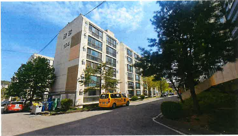
본건 동 전경