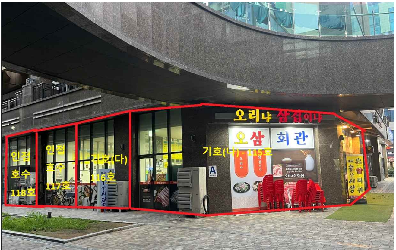
< 본건전경사진 기호(나, 다)>