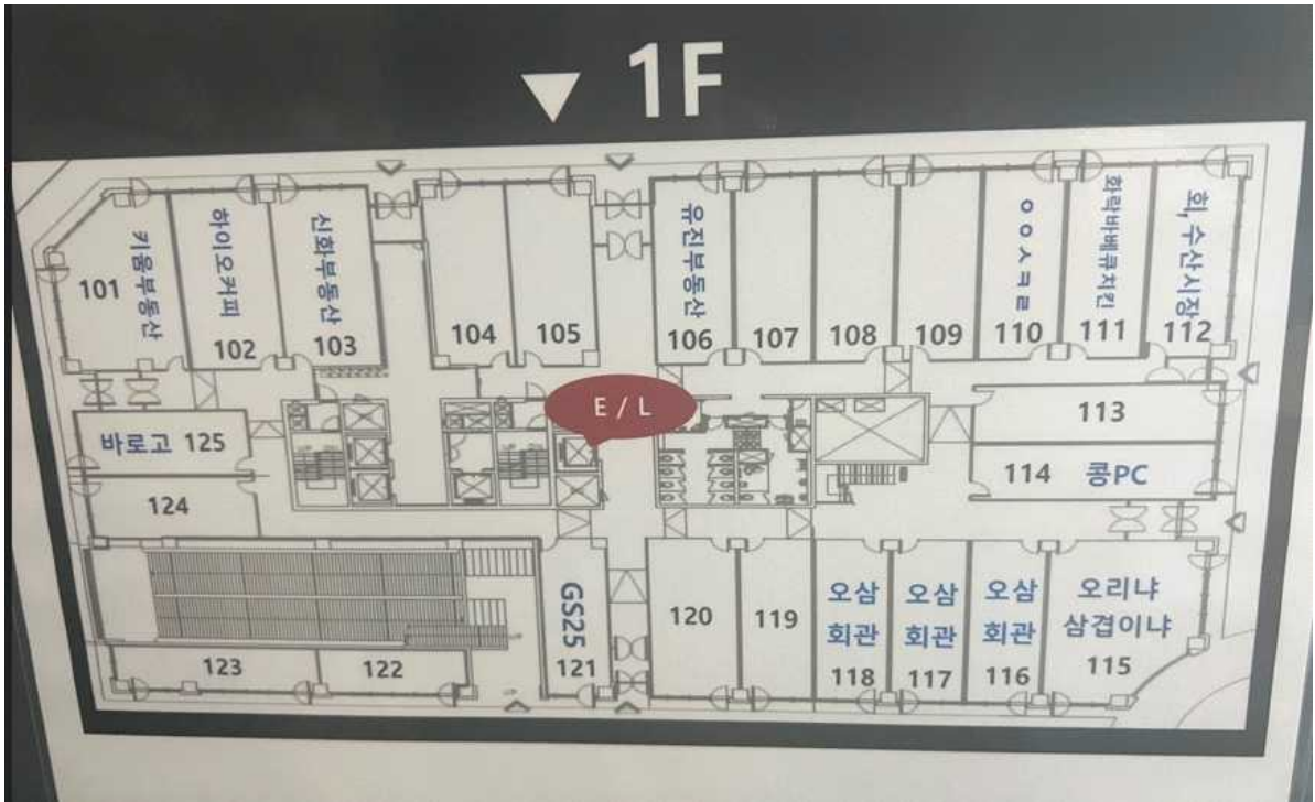
<1층 안내도 도면>