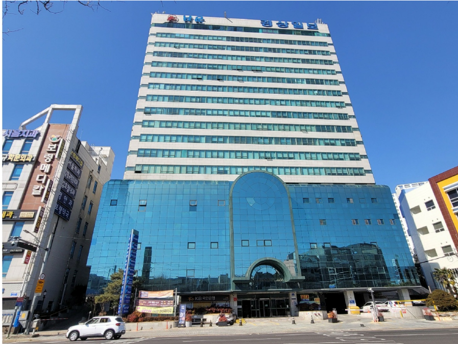
( 5 502 )