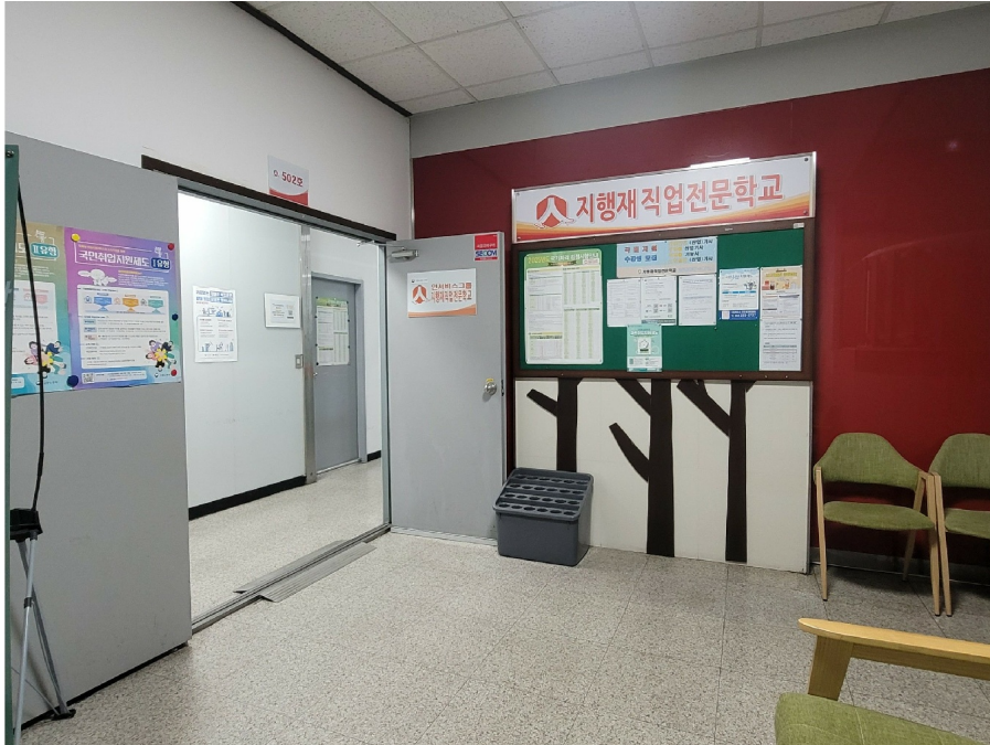
( 5 502 )