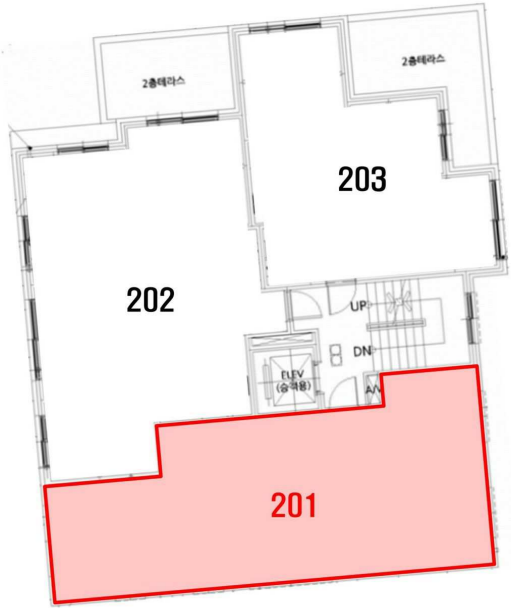
< 호별배치도 >