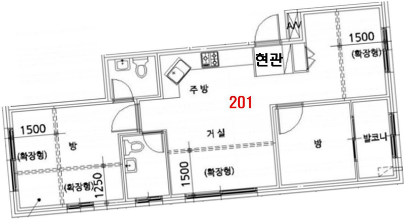
< 내부구조도 >