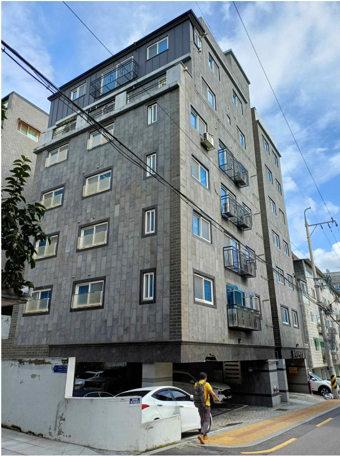
본건 소재 건물 북서측 전경