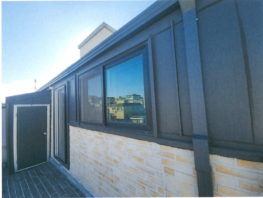
본건동 외부 테라스 부분 전경