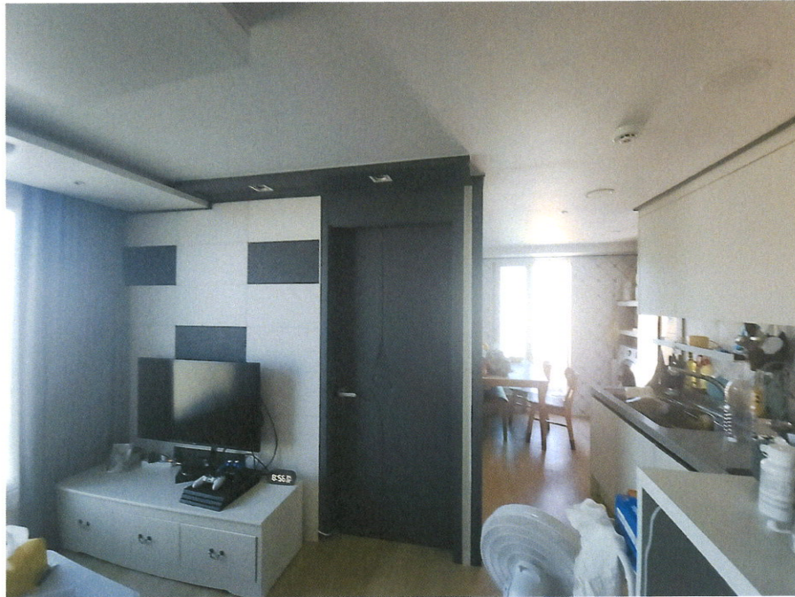
본건 내부 전경