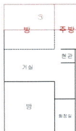
임 대 내 용